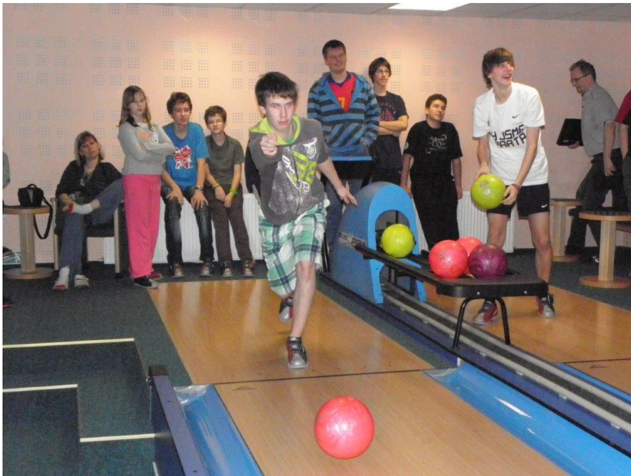
274 zábava na bowlingu