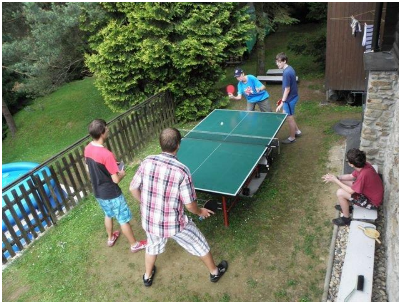
284 první fáze přípravy u Krčilů na rapidové MČR