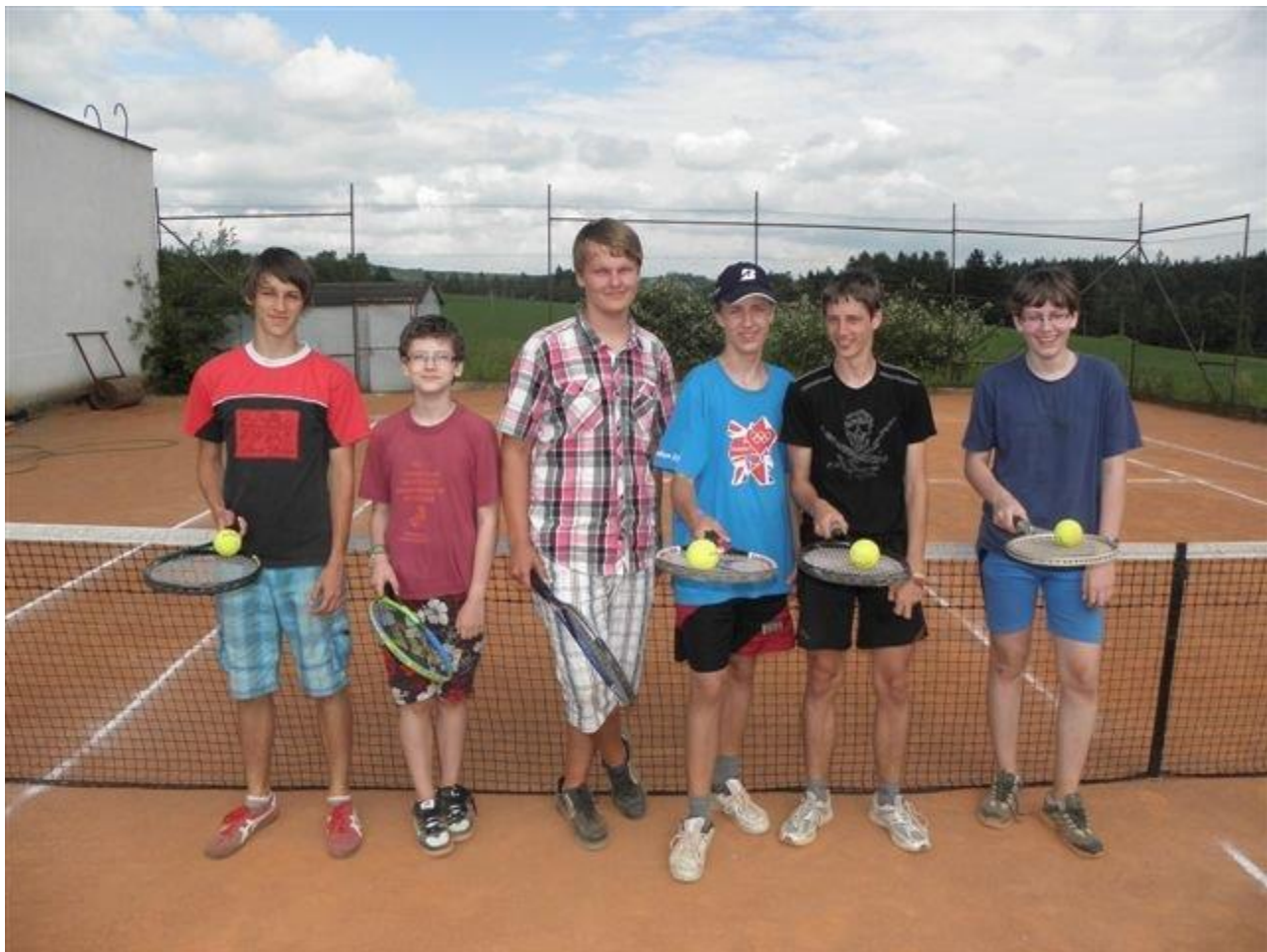
284 druhá fáze přípravy u Krčílů