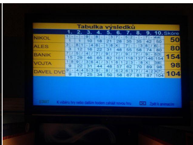
274 výsledky bowlingu

K relaxaci byl využit též hotelový bazén, kdo měl s sebou lyže, využil svahy v Koutech, Přemyslově nebo na Červenohorském sedle. Na pokojích se odehrávaly různé karetní a stolní hry. Týden v Jeseníkách tak utekl velmi rychle.