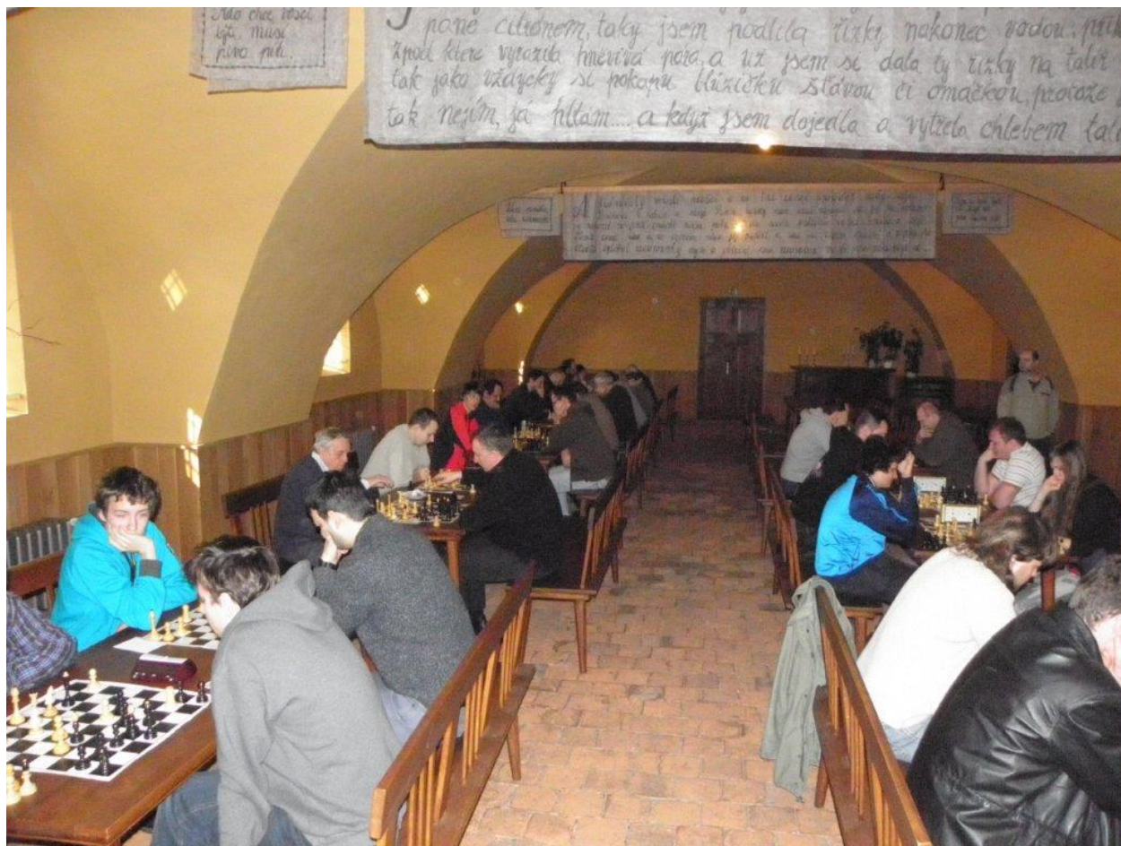
273 turnaj v pivovaru v Dalešicích