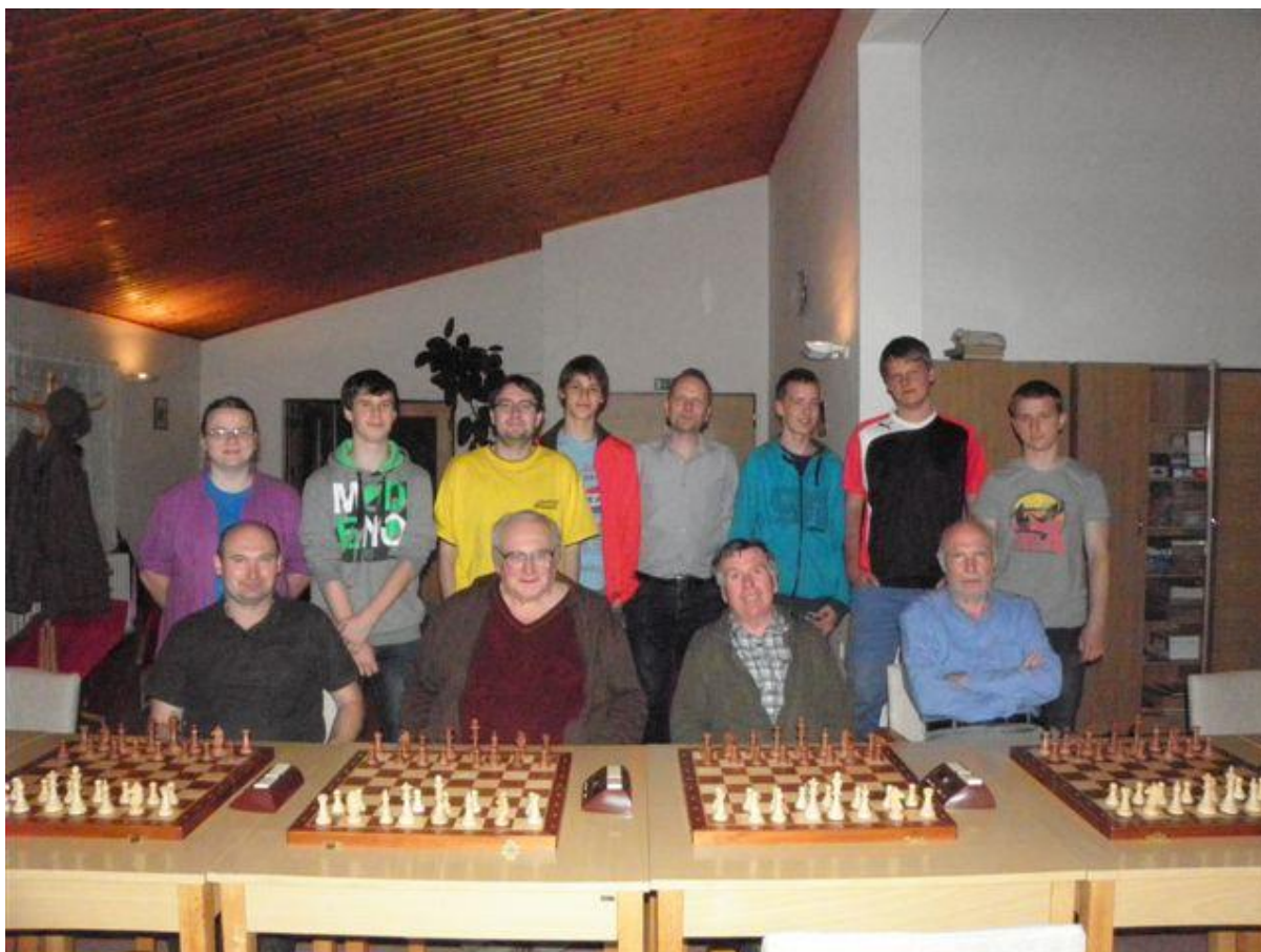
281 dvanáct účastníků bleskového přeboru