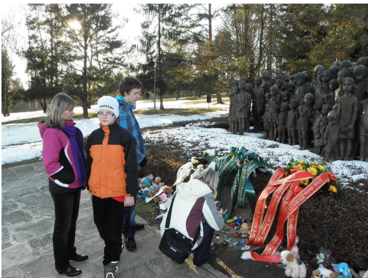
272 pietní místo u sousoší dětí