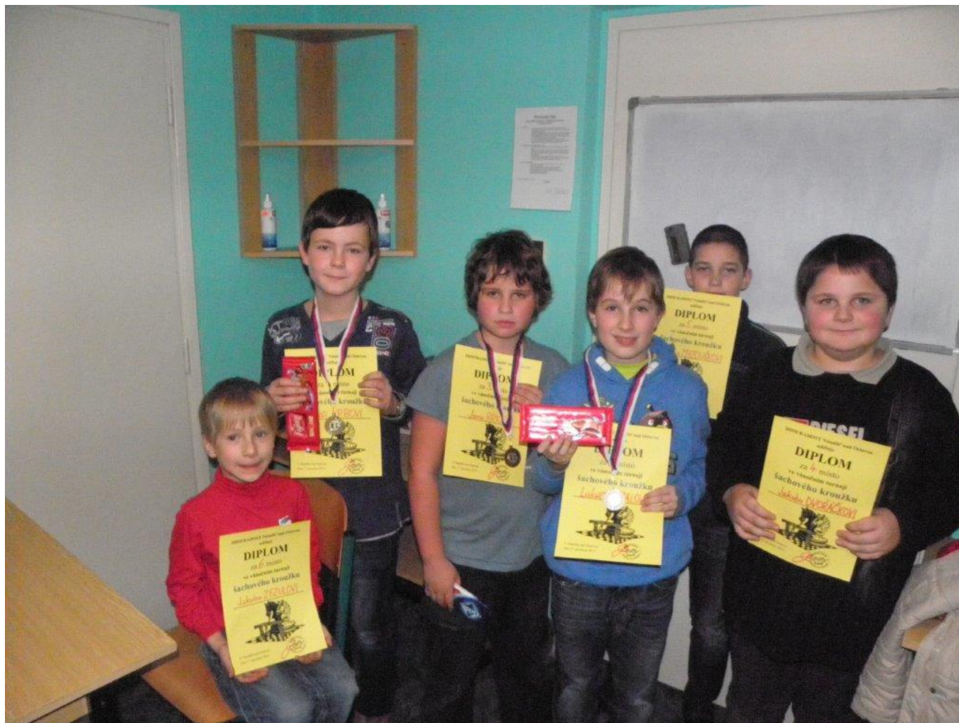
295 vánoční turnaj kroužku DDM