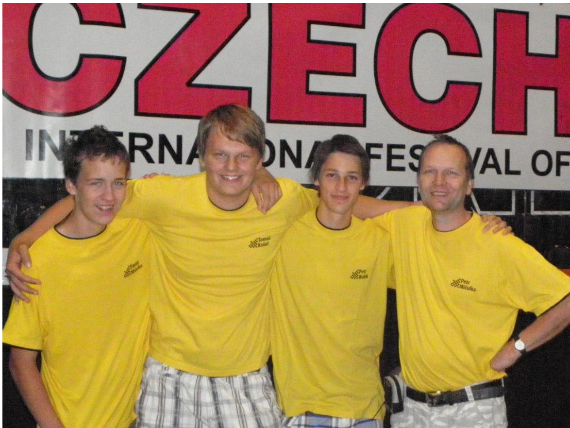
285 družstvo Náměště na MČR 4-členných družstev