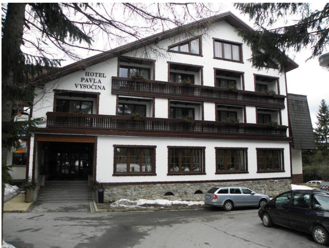
278 hotel Pavla, dějiště finále A i B ELD