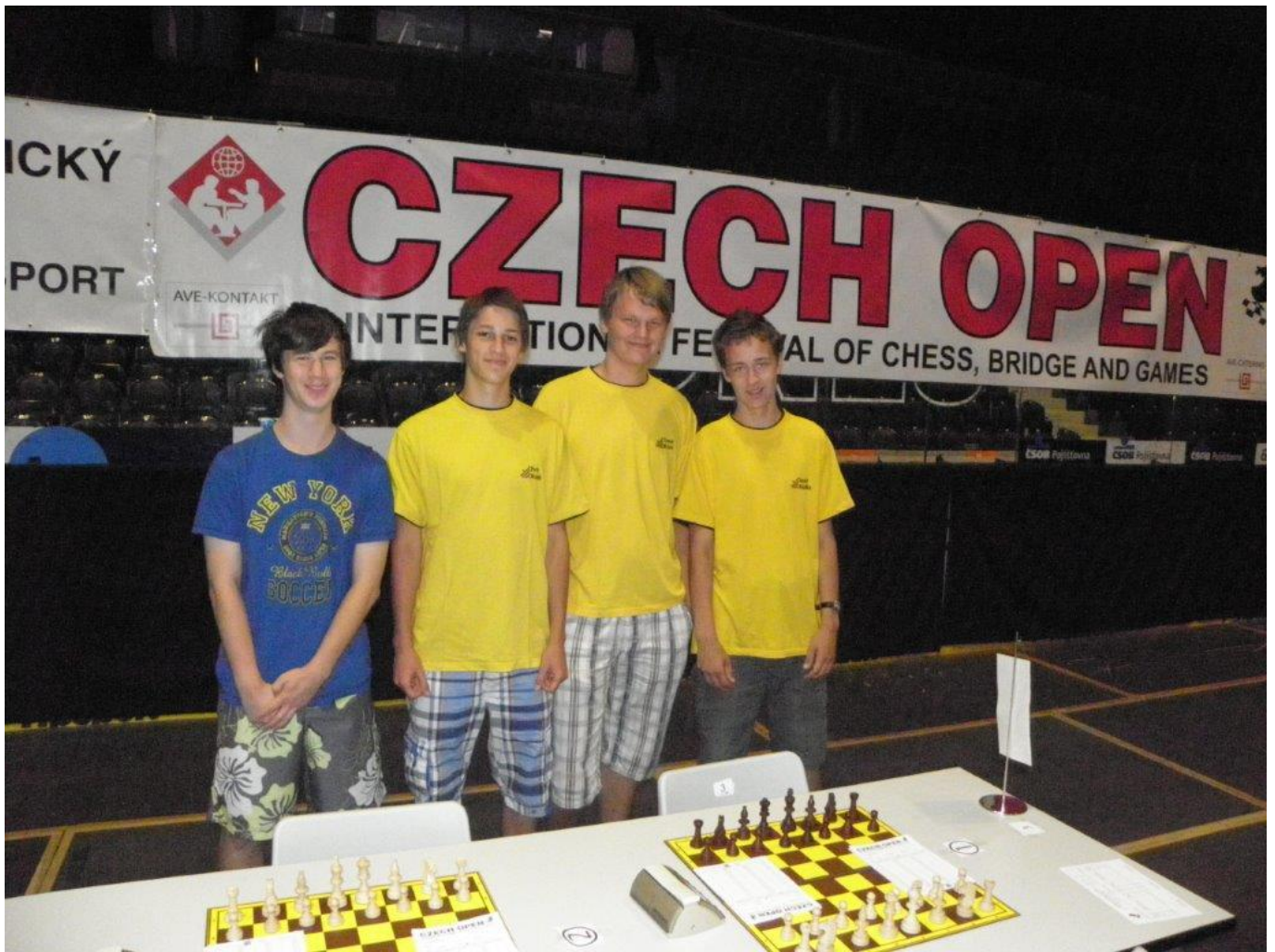
285 náměšťská mládež v Pardubicích