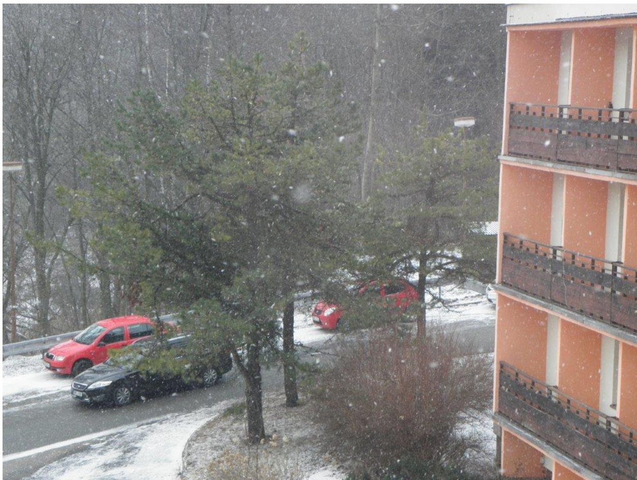
274 venku zrovna sněžilo