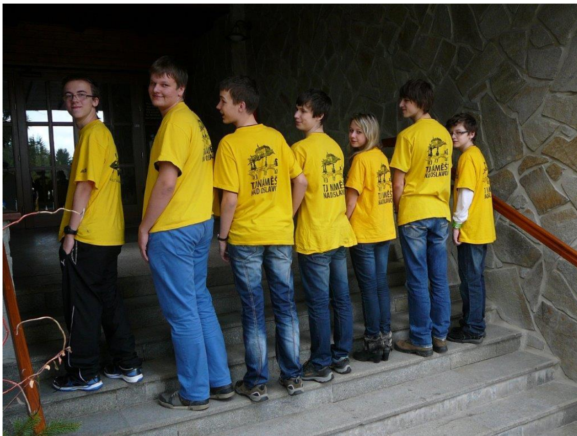
278 náměšťské dresy