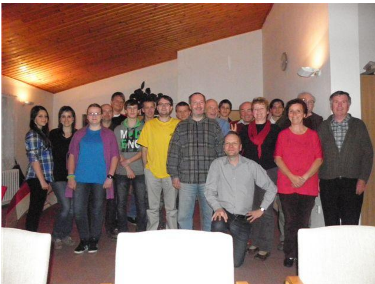
281 všichni zúčastnění