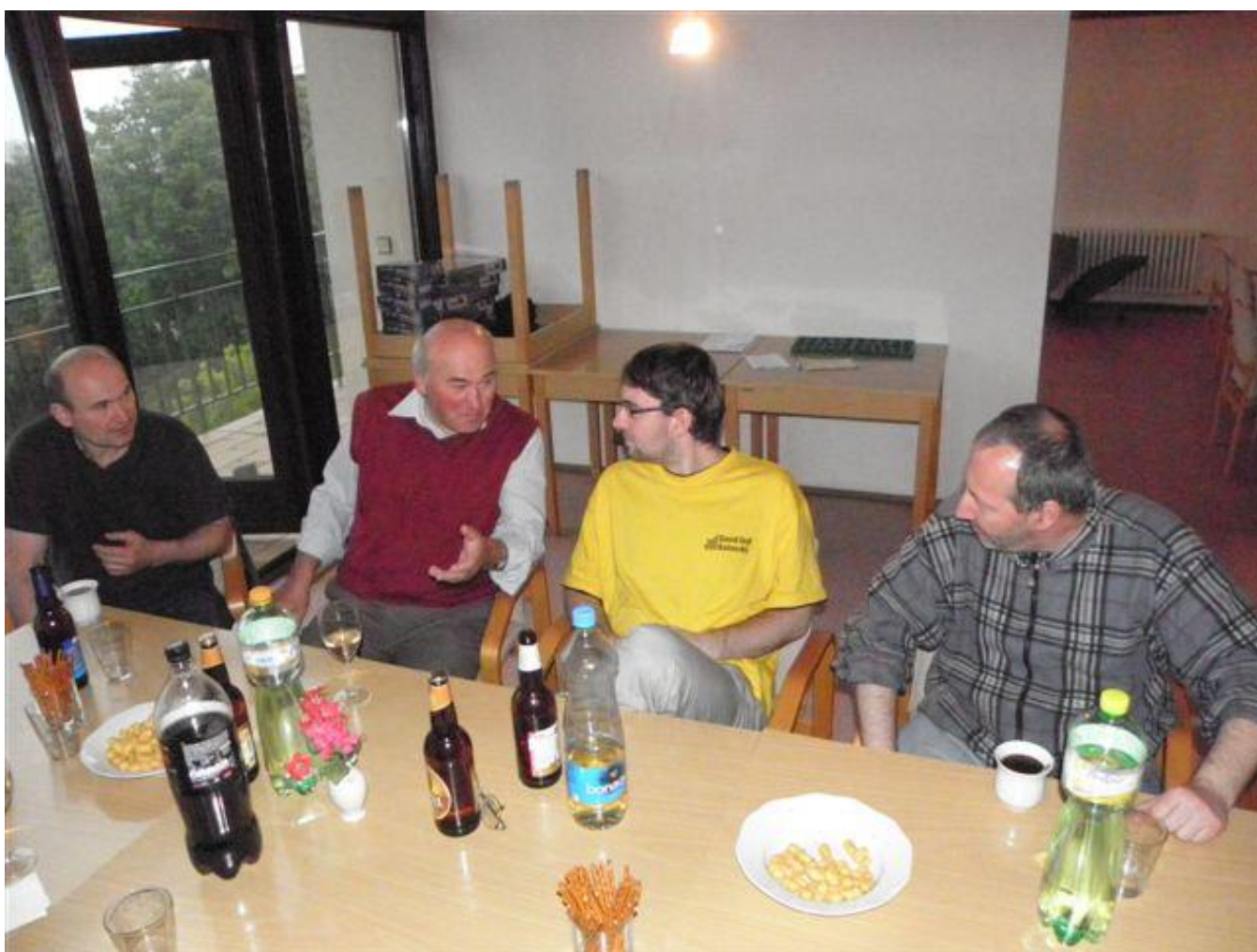
281 rozlučka se sezónou