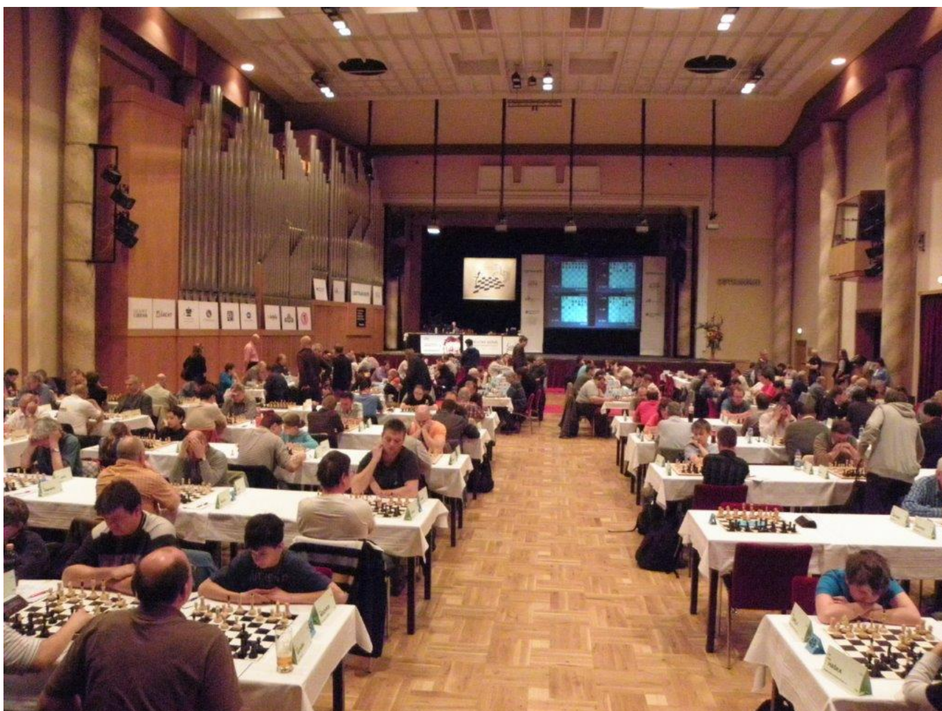
279 hrací sál v Ostravě