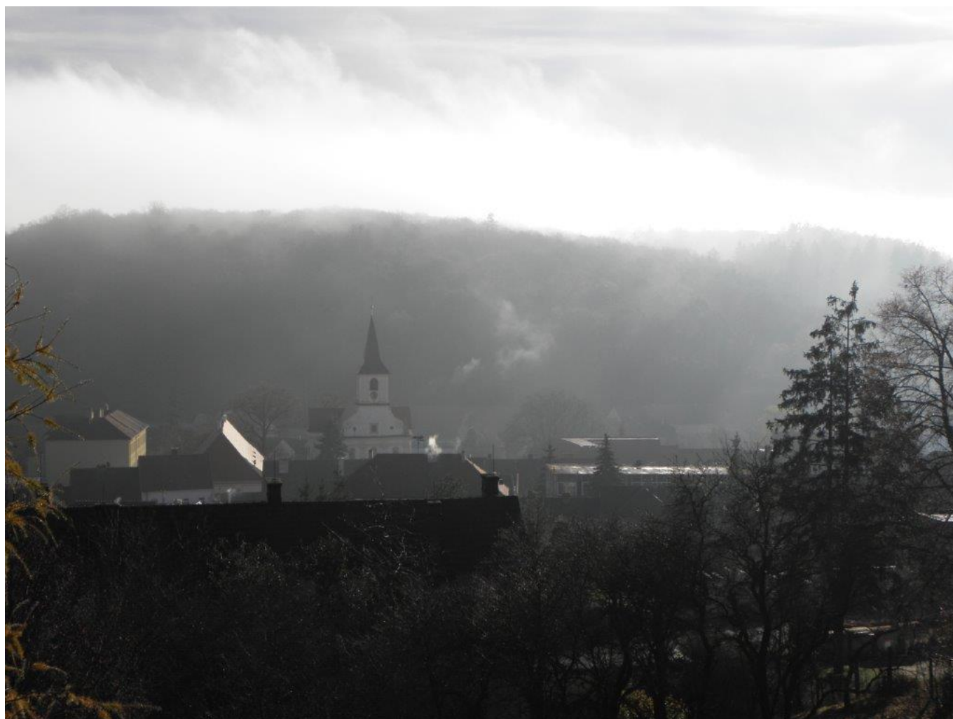
291 romantická Náměšť při zahájení KP družstev