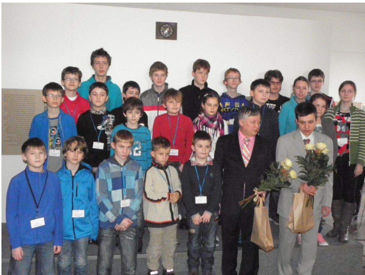
272 společné foto účastníků simultánky