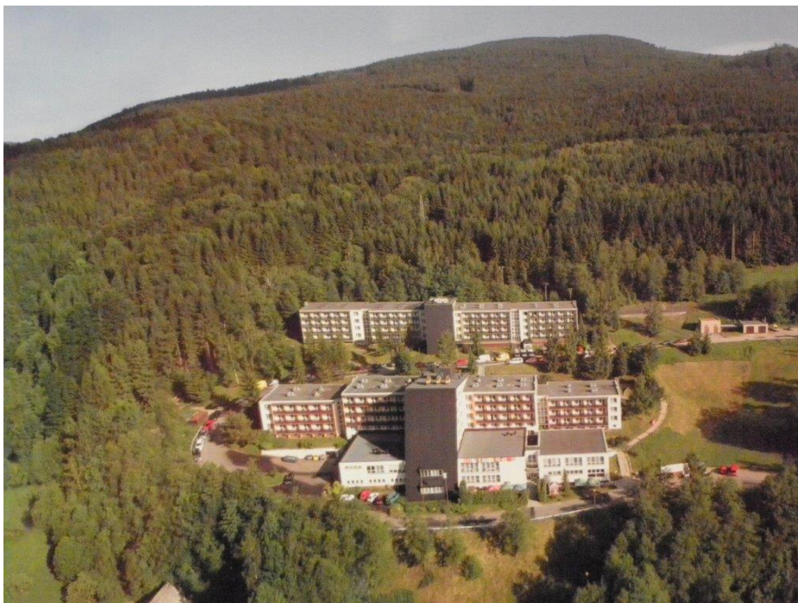
289 hotel Dlouhé Stráně