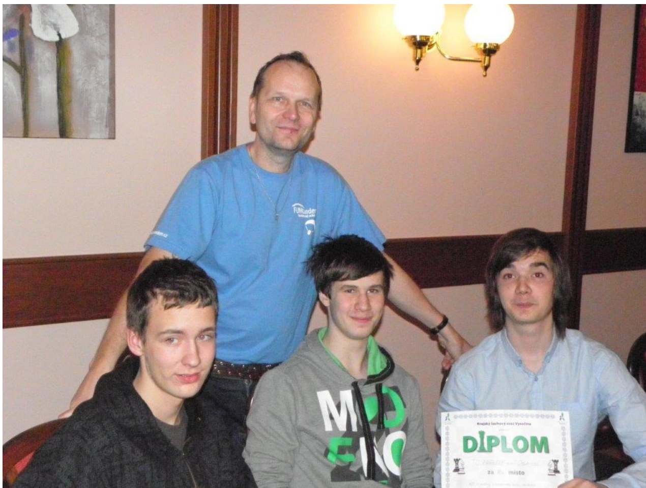
297 TJ Náměšť třetí v KP družstev blesk