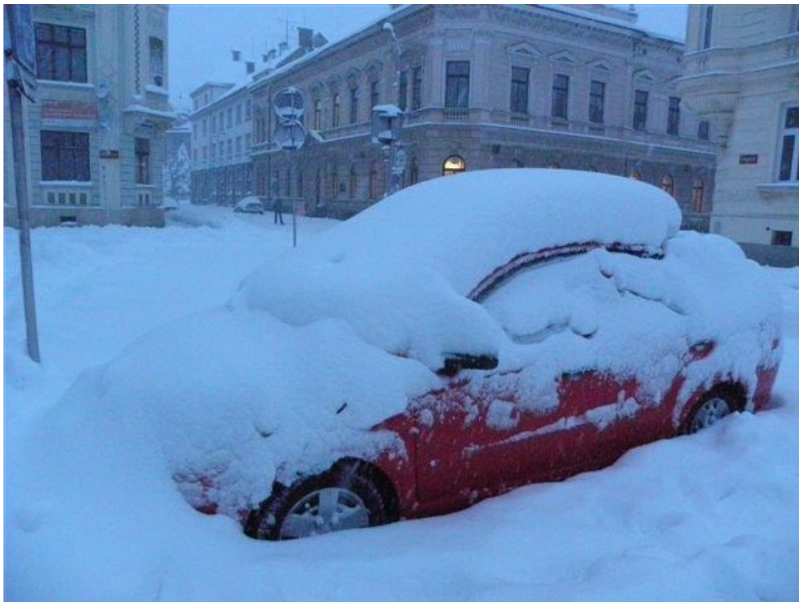
276 sněhová nadílka před Národním domem ve Frýdku-Místku