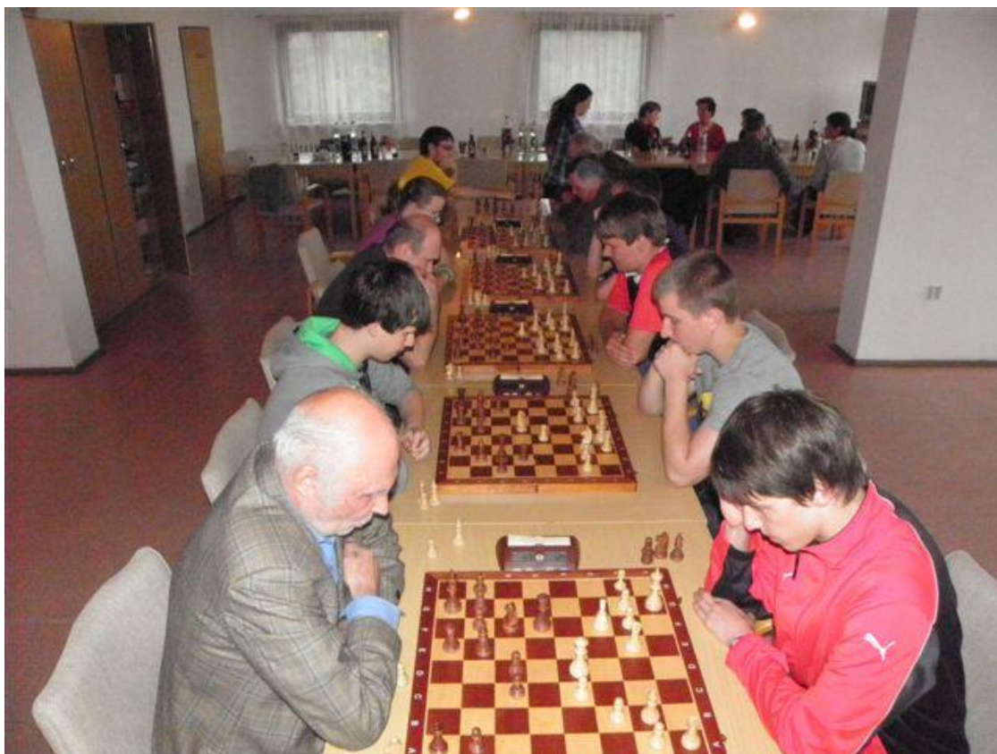
281 bleskový přebor oddílu