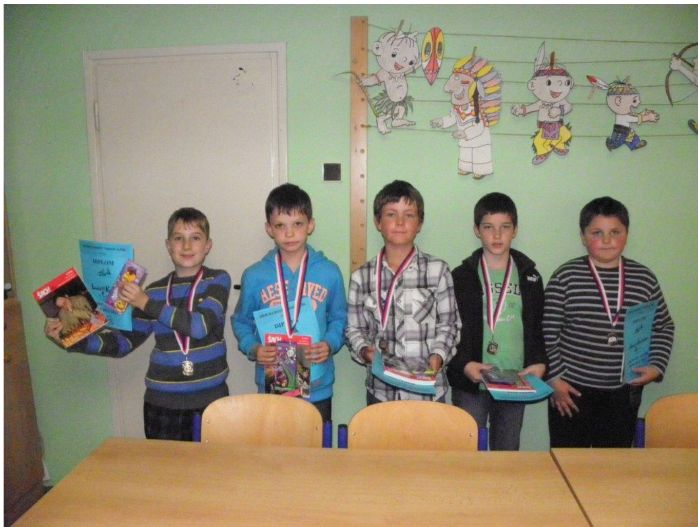
283 závěrečný kroužek DDM s turnajem