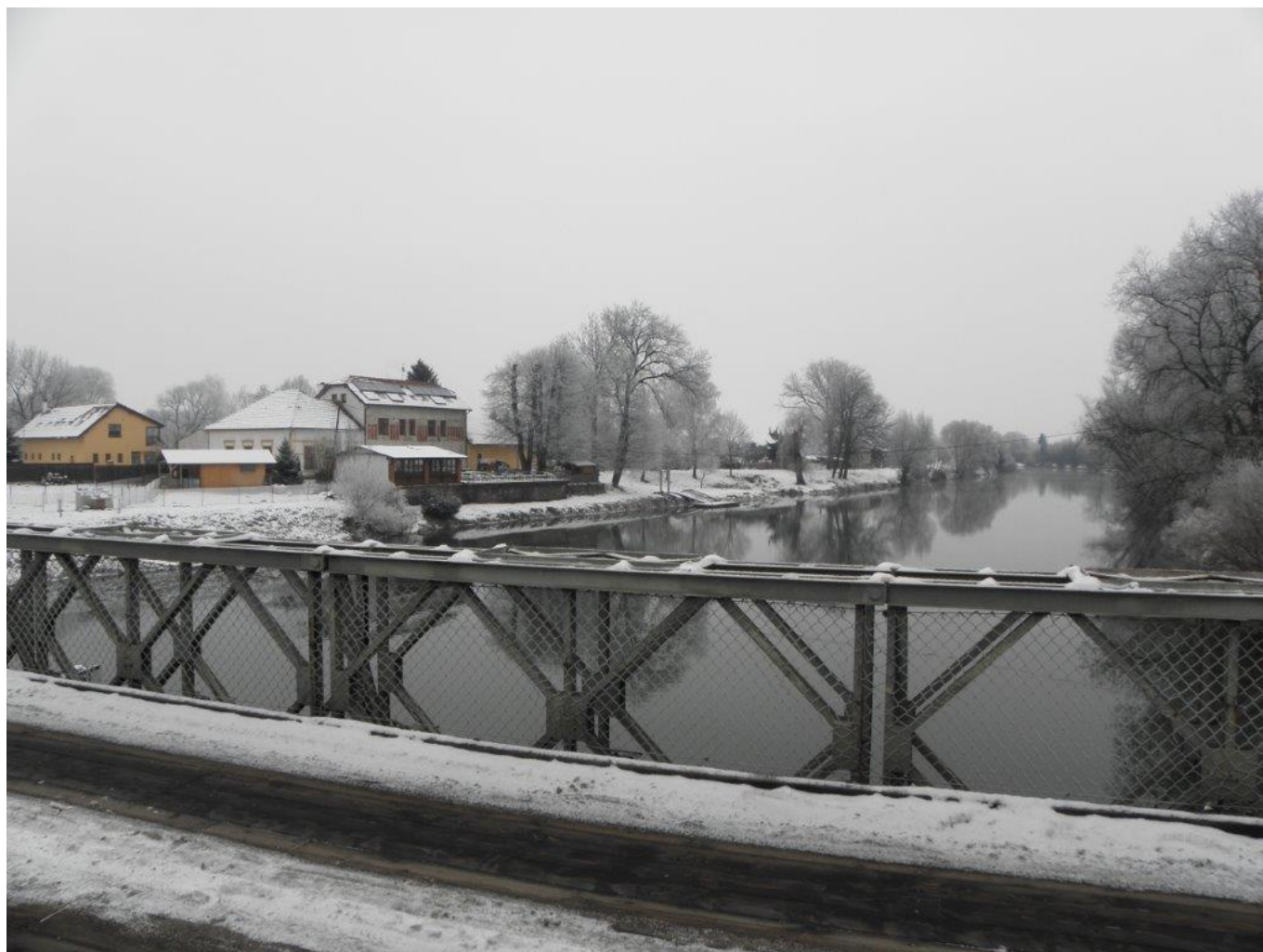
269 hostinec U Přívozu Kunětice