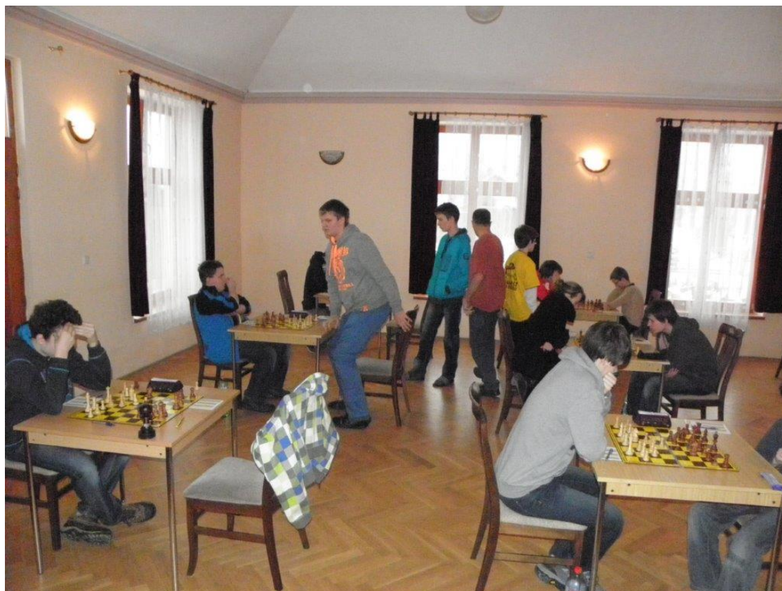
269 hrací místnost v Kuněticích