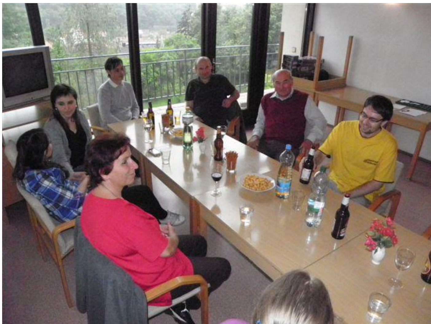
281 posezení v Penzionu