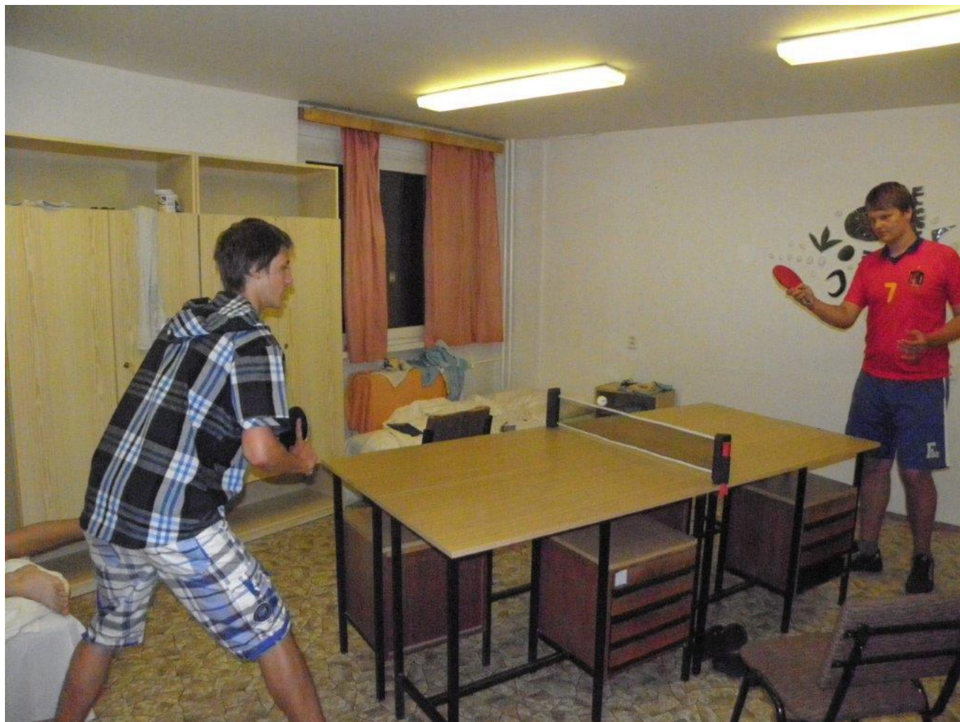
285 improvizovaný pinec na kolejích