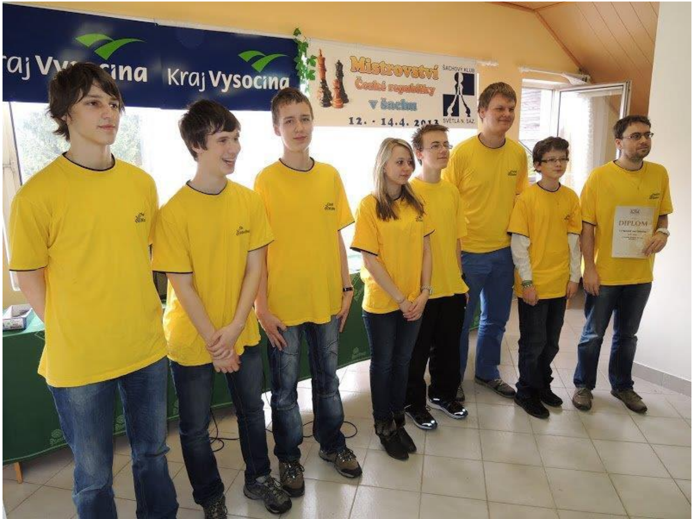
278 Náměšť při vyhlášení