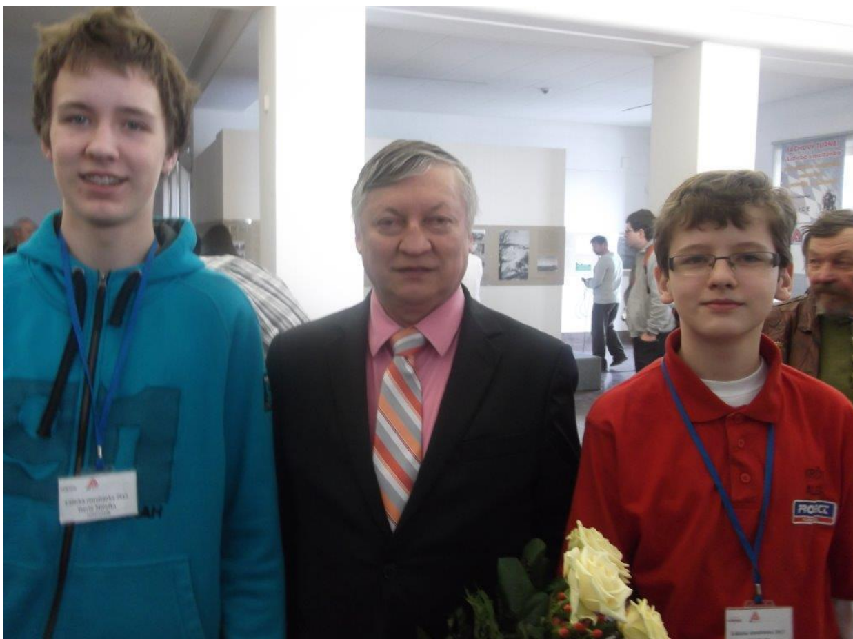
272 kluci s exmistrem světa Anatolijem Karpovem