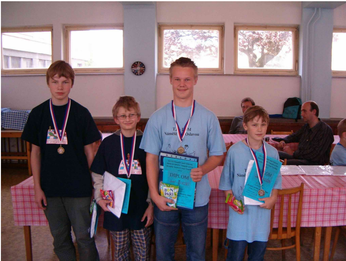
bronzoví medailisté KP 2006