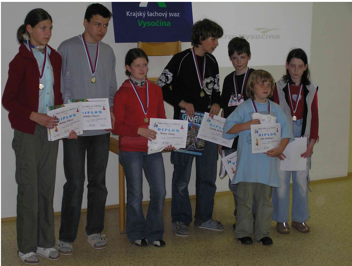
Liga Vysočiny - stříbrní