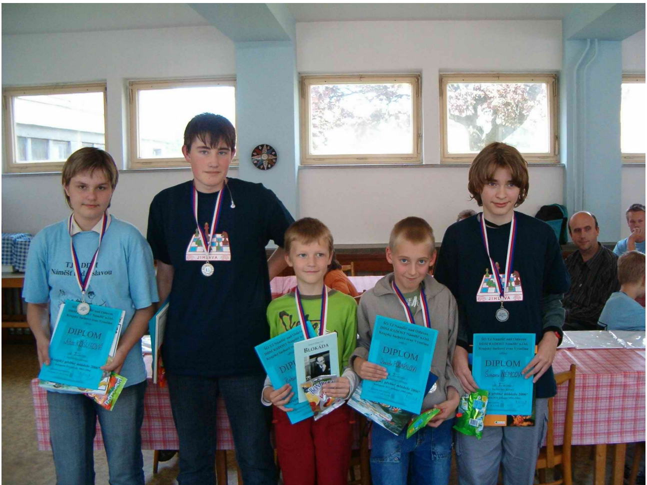
stříbrní medailisté KP 2006