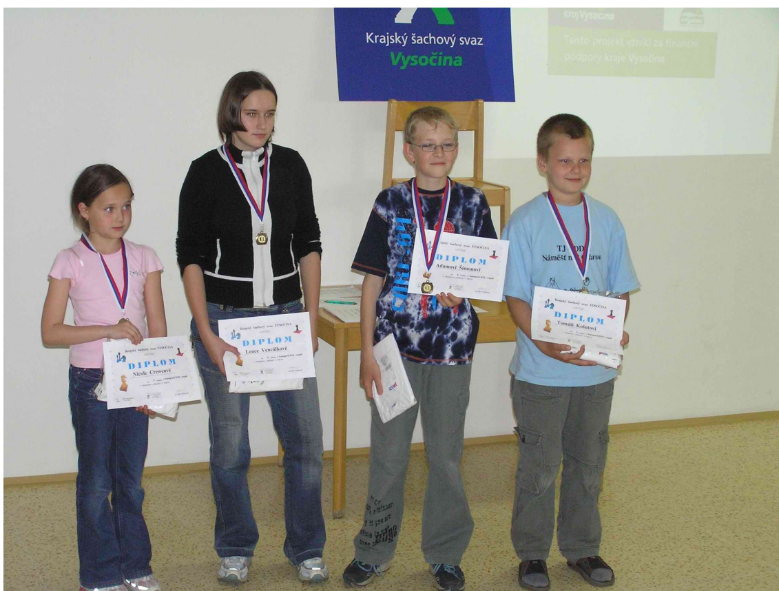
Liga Vysočiny - bronzoví