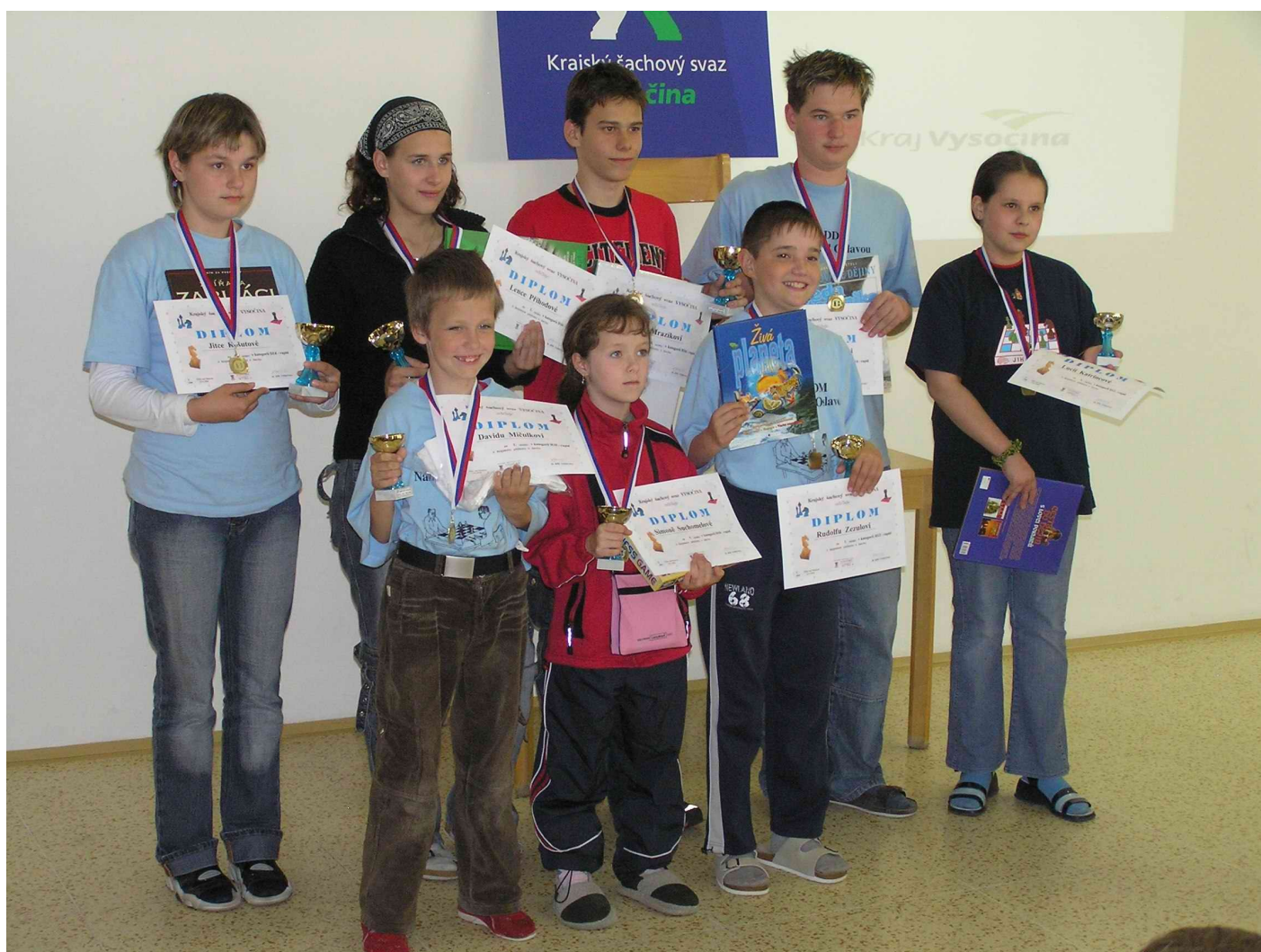
Liga Vysočiny - zlatí