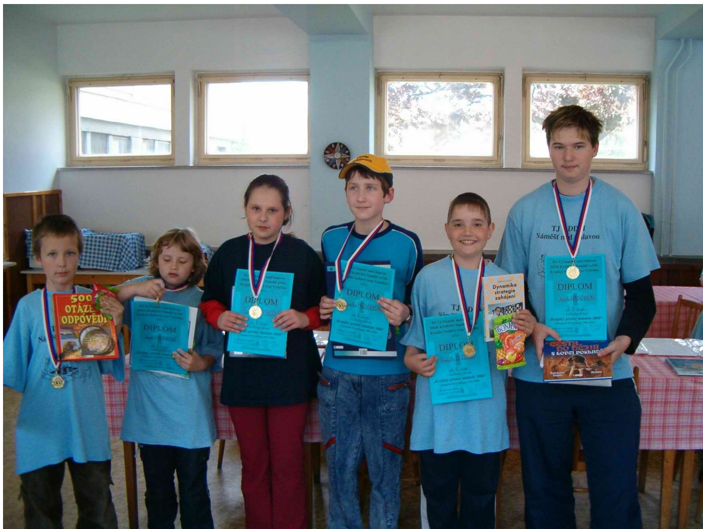
Krajští přeborníci 2006