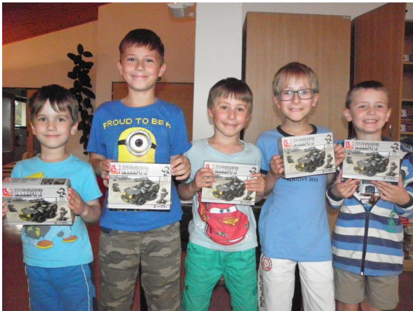
372 přebor žáků do 15 let š.o. TJ Náměšť nad Oslavou