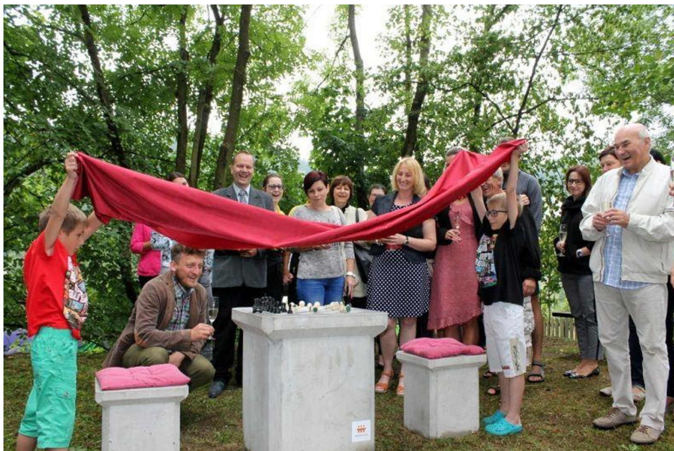
375 šachy v parku

Našel jsem další článek s jinými fotkami: http://www.regionvysocina.cz/zpravodajstvi/sachove-partie-na-cerstvem-vzduchu-v-namesti-130348/