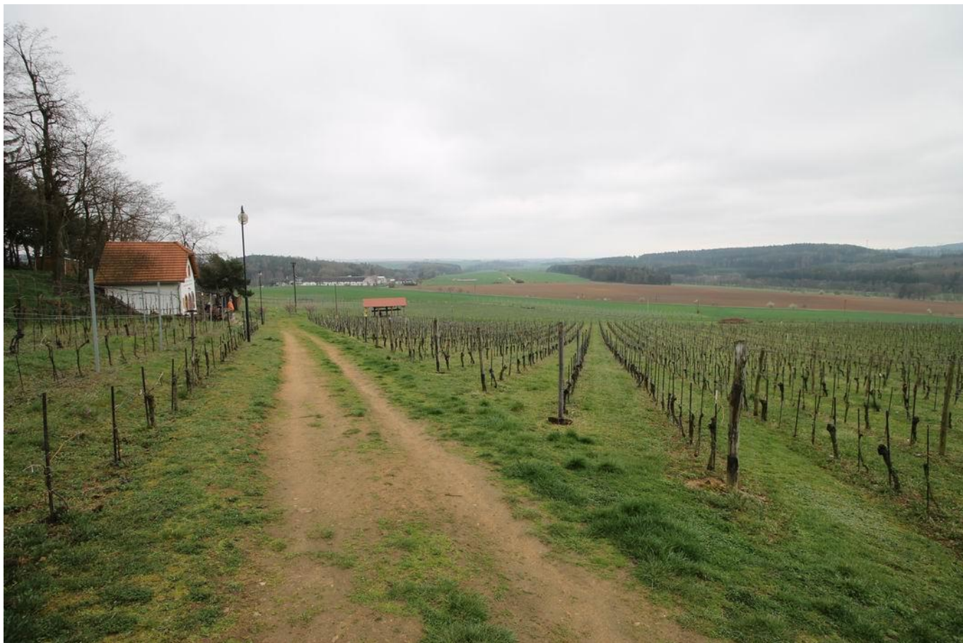
368 vinice na Sádku