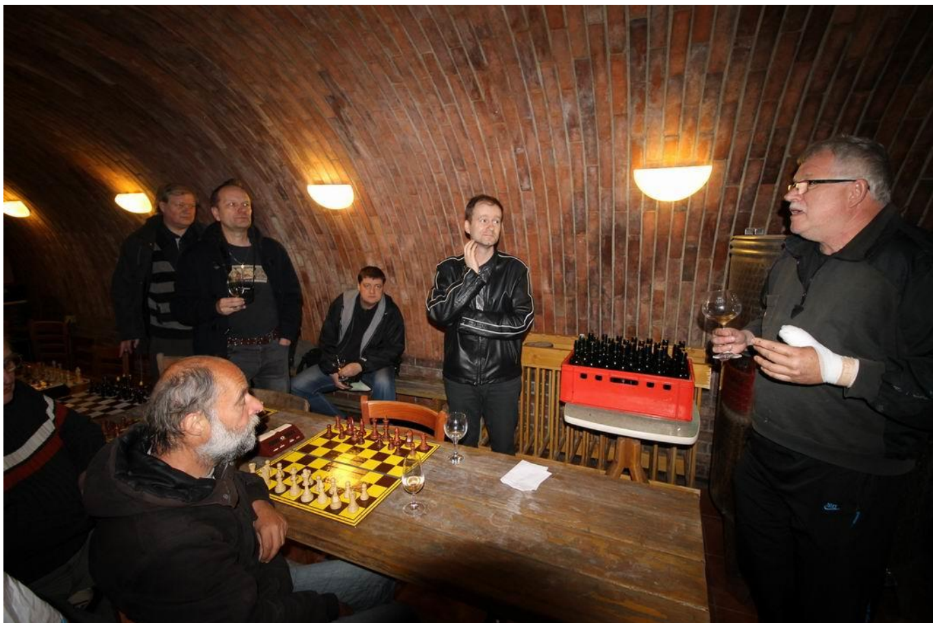
368 zajímavé povídání pana Lampíře o víně