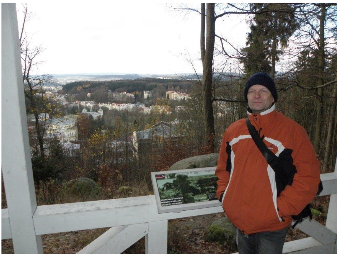
384 na jedné z procházek kolem Mariánských Lázní