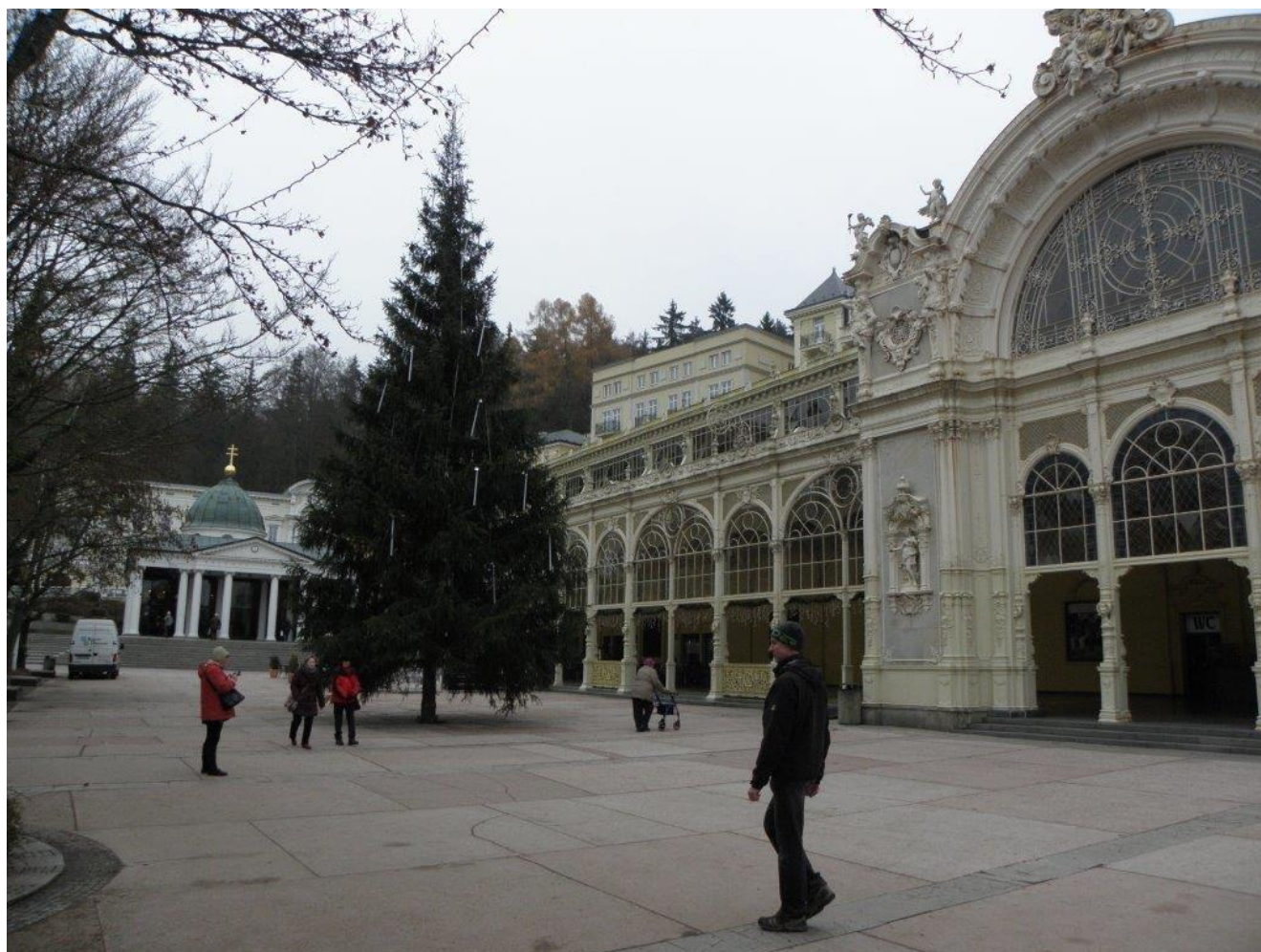
384 kolonáda v Mariánských Lázních