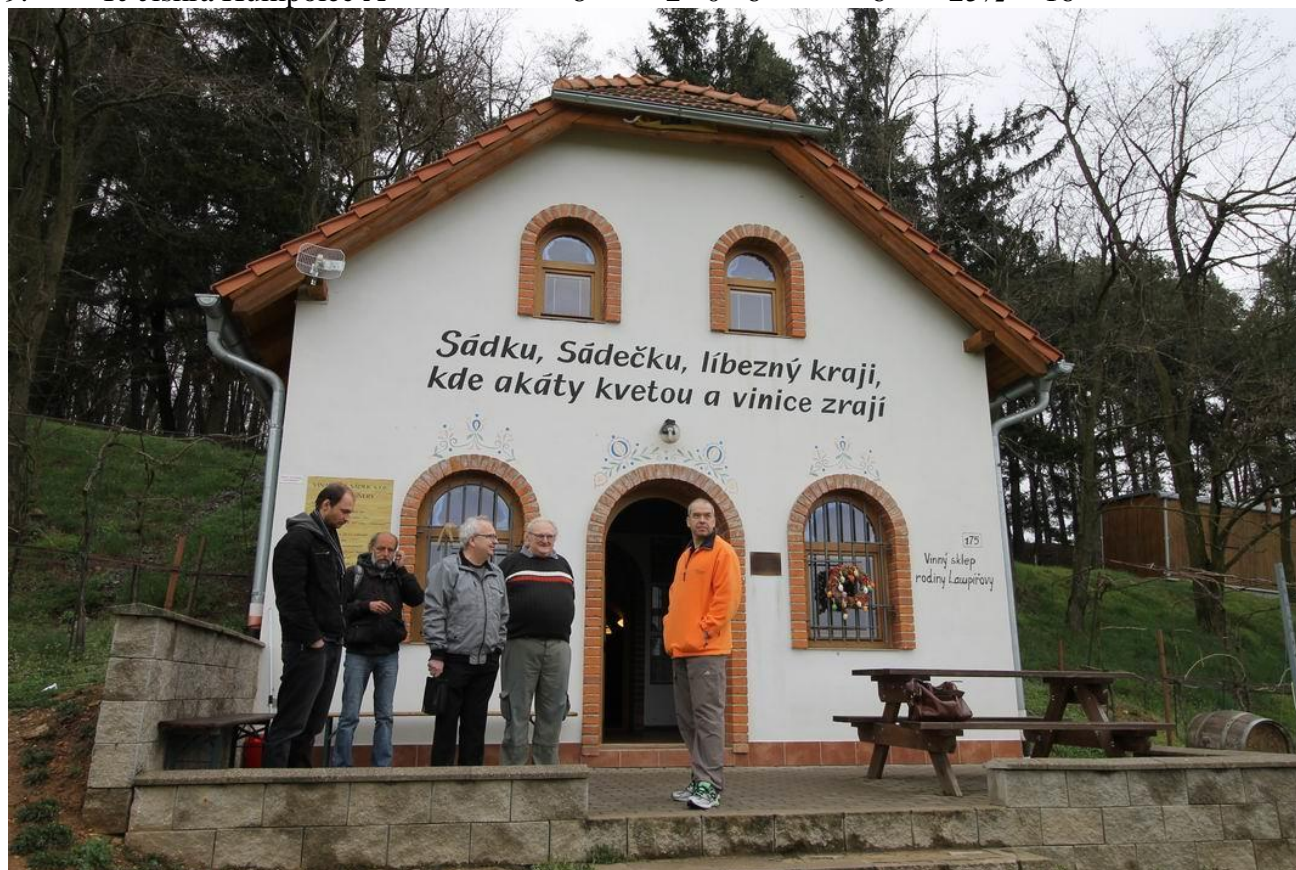
368 Sádek – sklípek rodiny Lampířových