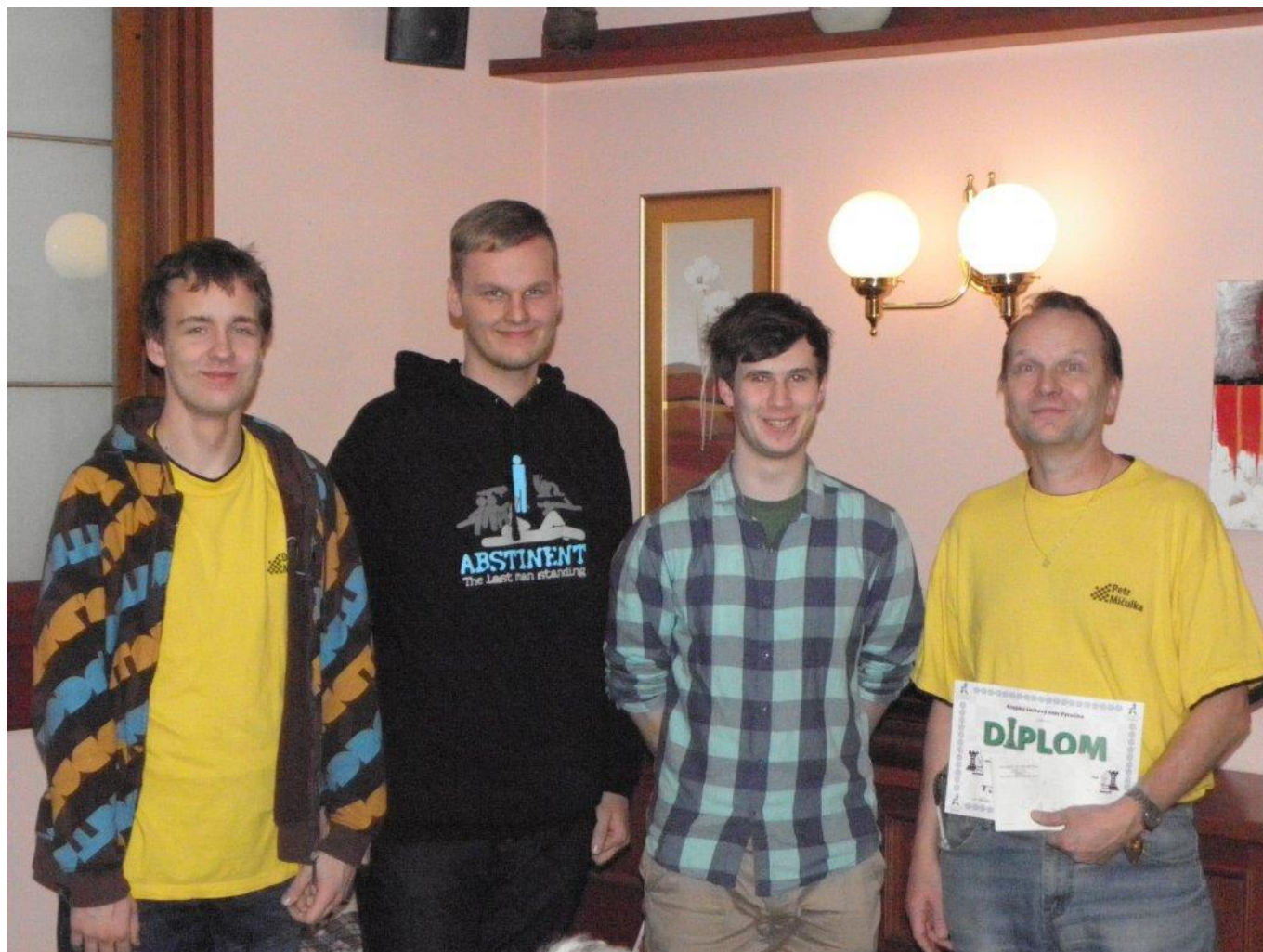
389 družstvo Náměště druhé na KP v bleskovém šachu

Absolutní pořadí: 1. Vala 15,5, 2. Karásek 14,5, 3. Vít Kratochvíl 13,5 ...10. David Mičulka a 11. Petr Walek po 9,5, 19. Tomáš Košut a 23. Petr Mičulka po 9 ... Zajímavý byl vyrovnaný střed celkového pořadí – hned 28 hráčů na 14.-41. místě bylo v rozmezí pouhého 1 bodu!