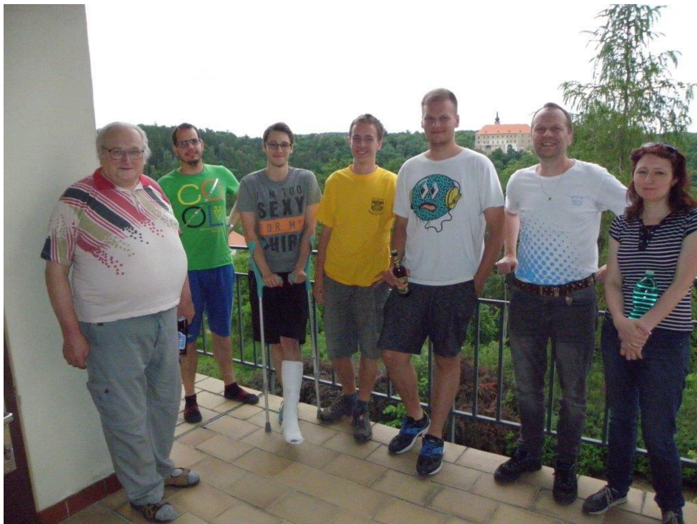
372 účastníci bleskového přeboru oddílu