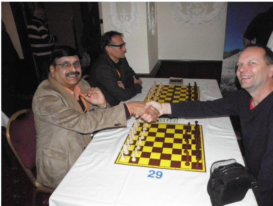
384 soubor Indie - ČR