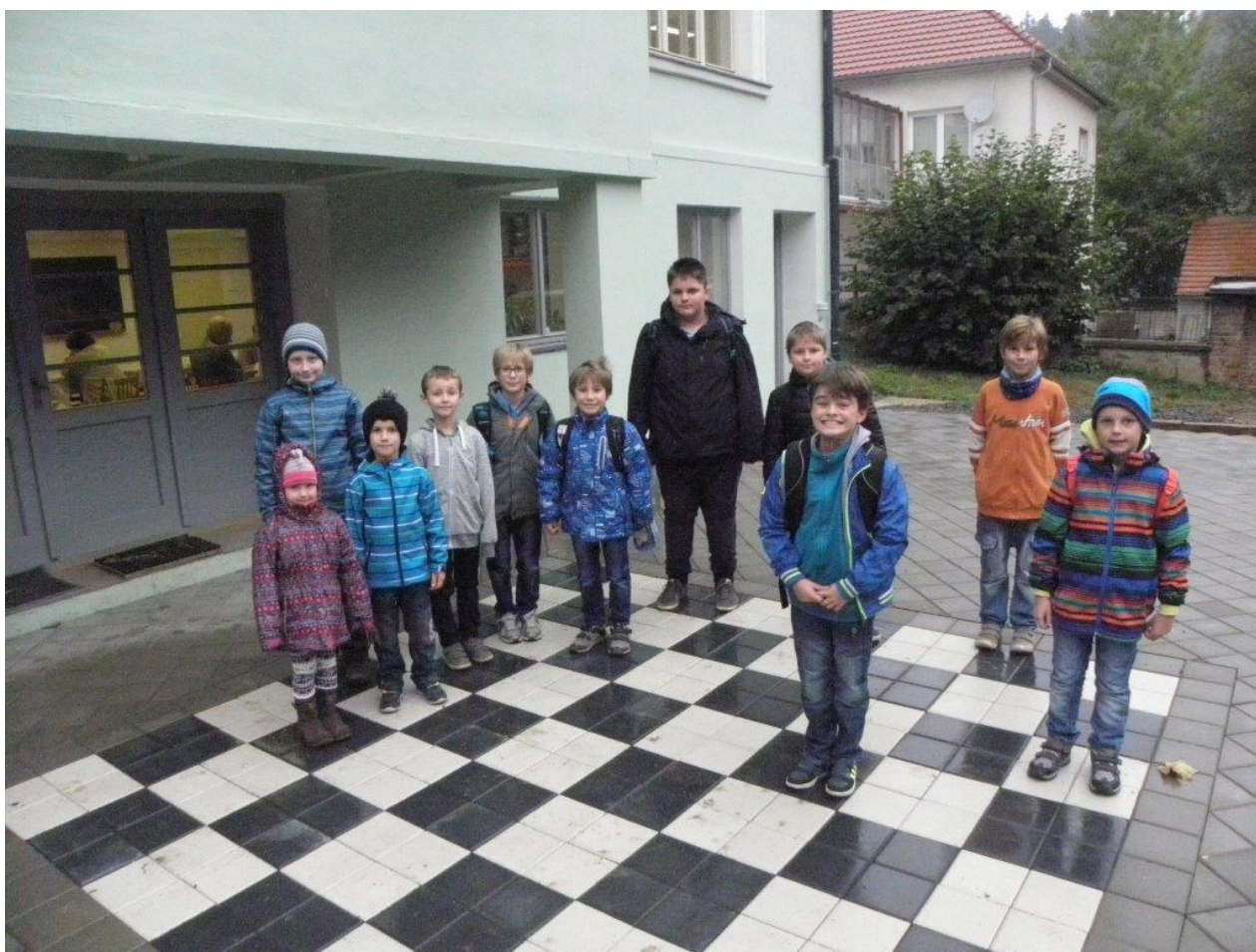
379 kroužek DDM – venkovní šachovnice