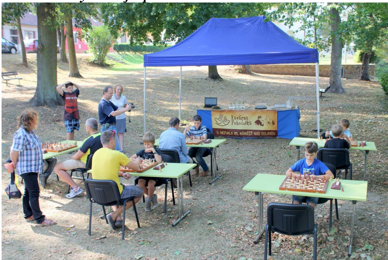
377 turnaj v parku