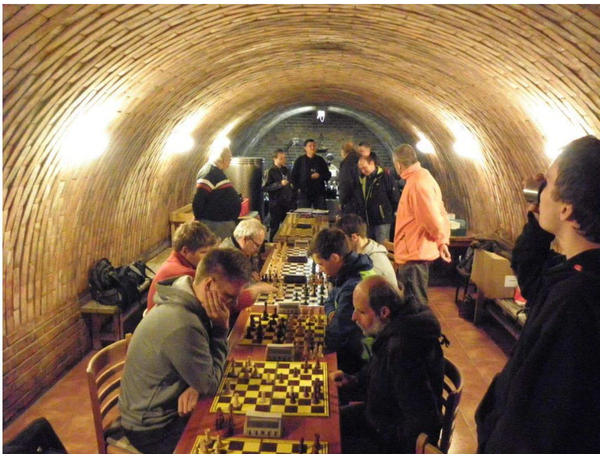
368 bleskový zápas na Sádku