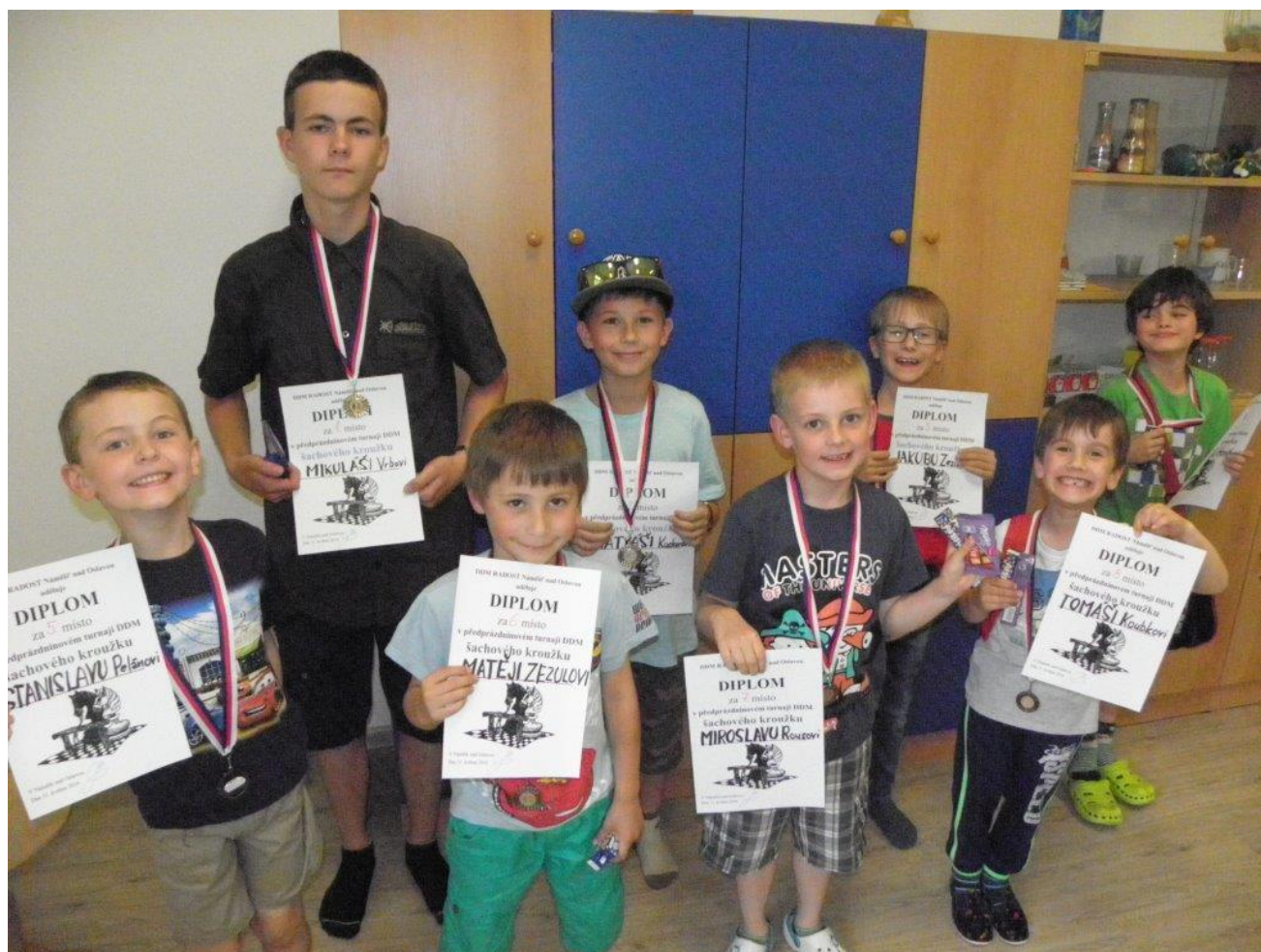
371 předprázdninový turnaj DDM