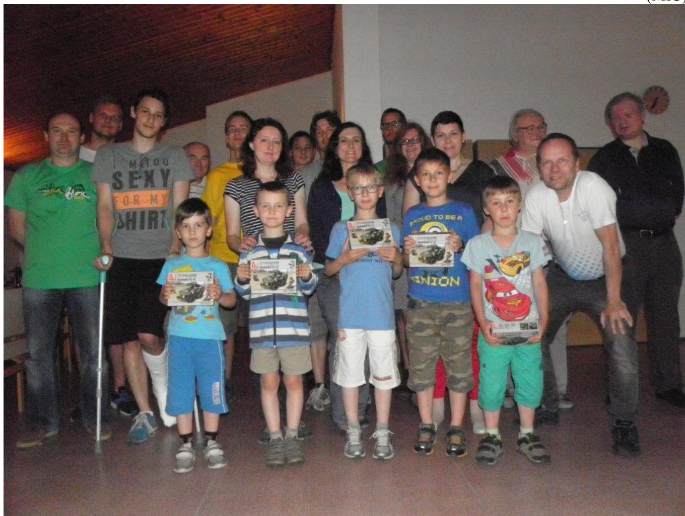
372 společné foto rozlučka 2016