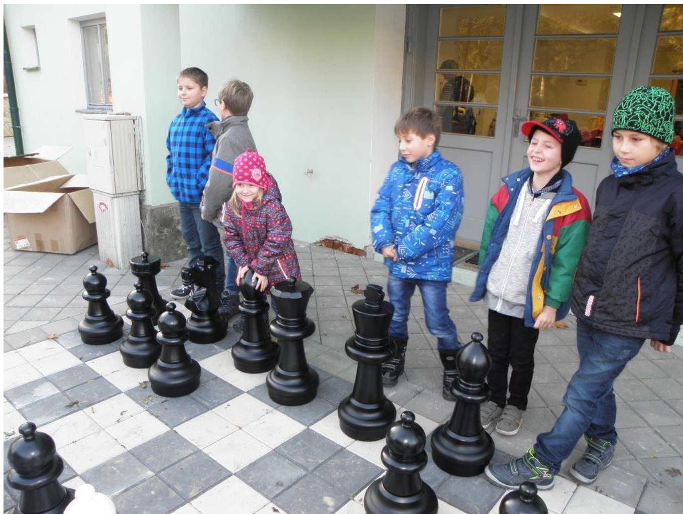
381 venkovní šachy