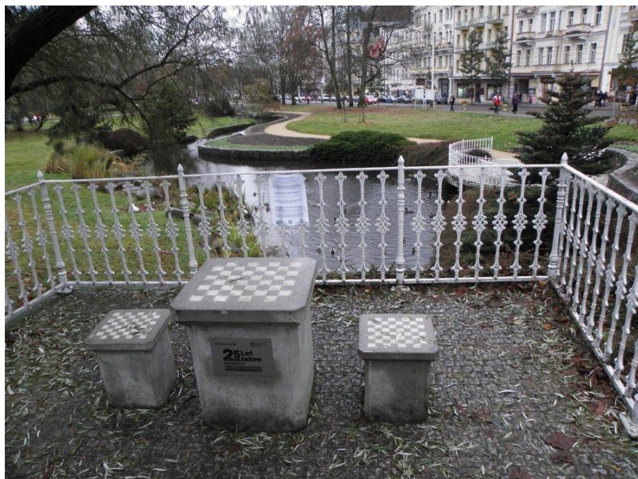
384 šachy v parku před hotelem Polonia, ve kterém jsme bydleli