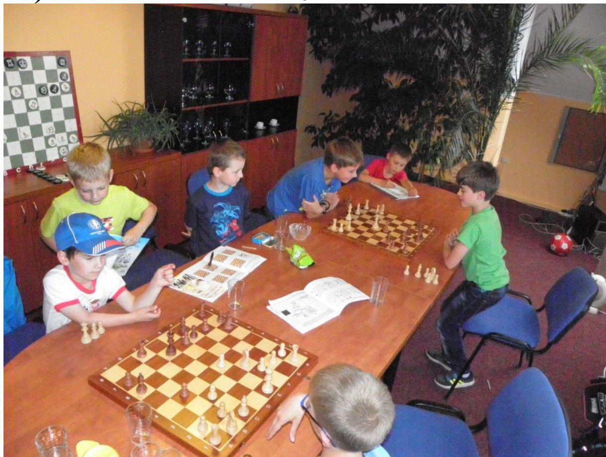
374 první letní trénink mládeže