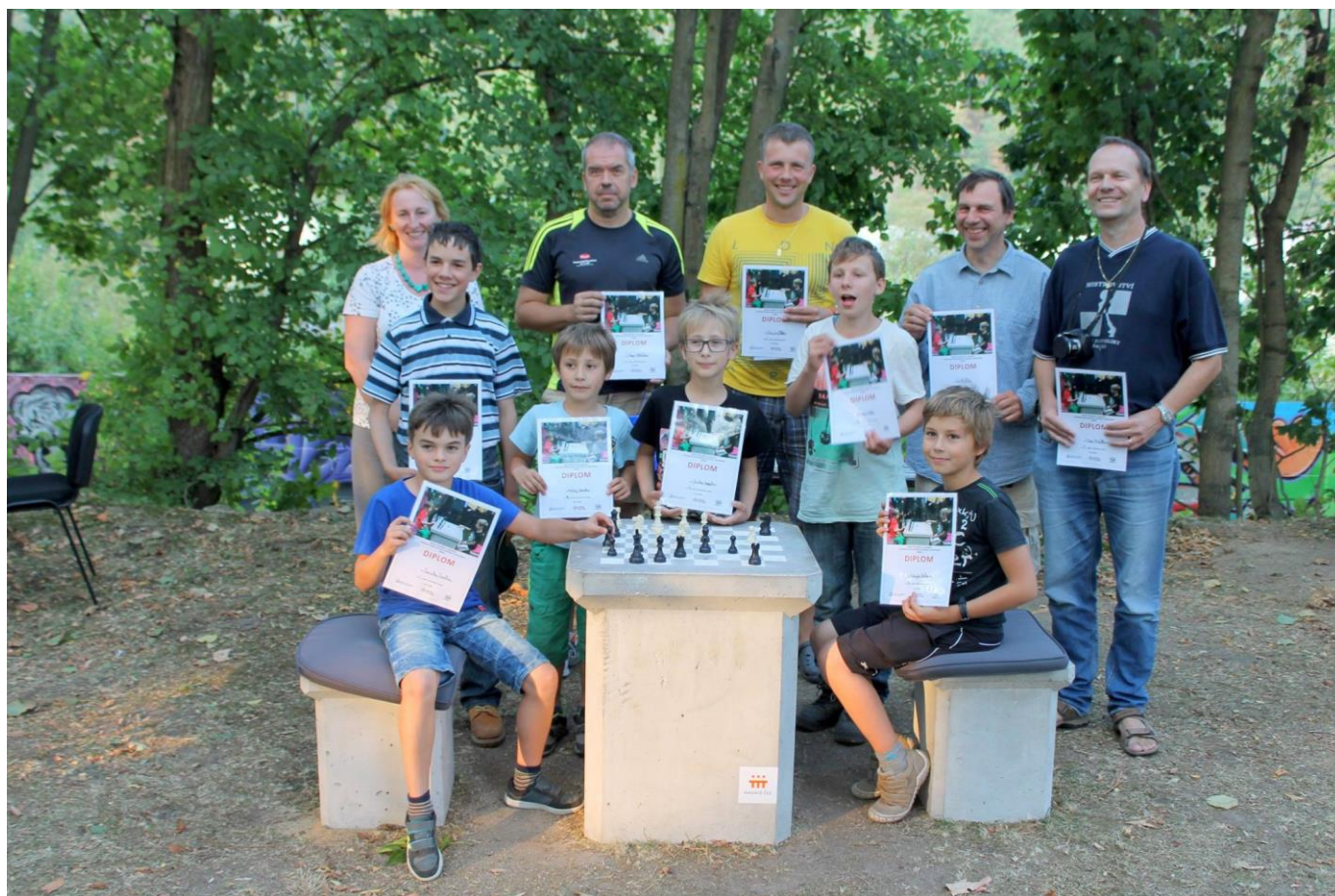
377 turnaj v parku