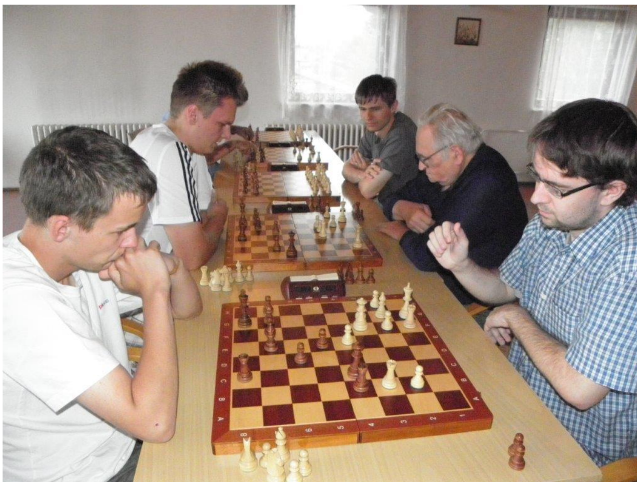
318 z bleskového turnaje