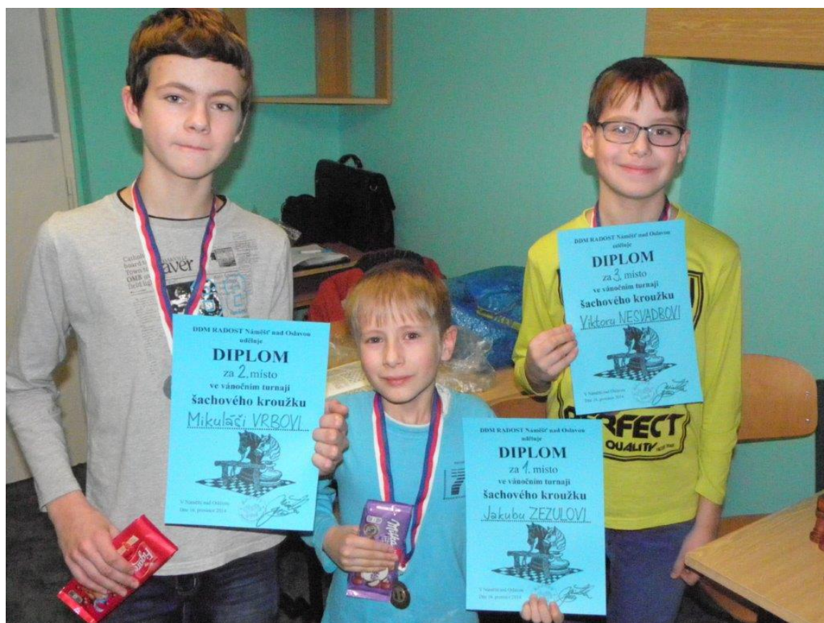
330 Vánoční turnaj v DDM na ulici Nové