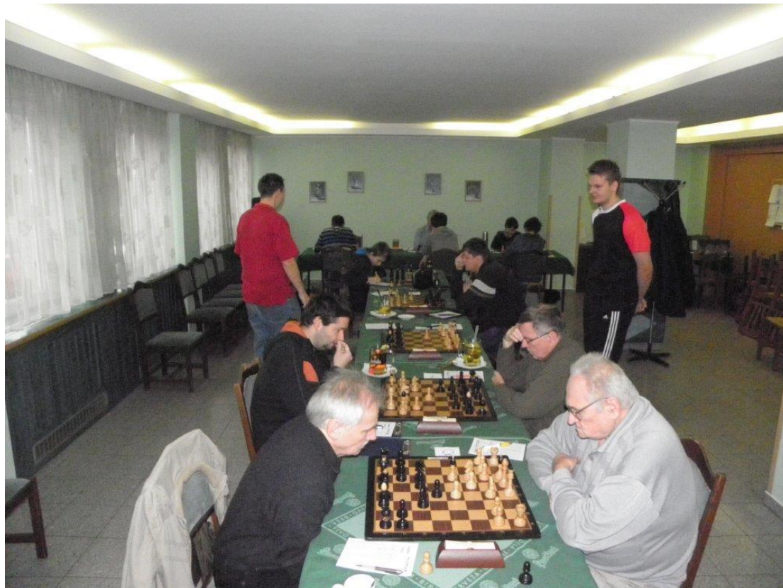
328 hrací sál v Jihlavě

Krajský přebor Vysočiny osmičlenných družstev má za sebou 3 kola. Náměšťští šachisté v prvním kole remizovali v Havlíčkově Brodě 4:4, ve druhém kole zvítězili nad Humpolcem 5:3 a ve třetím vyhráli v Jihlavě nad Gambitem B rovněž 5:3. V průběžné tabulce se Náměšť dělí se Světlou nad Sázavou o 1.-2. místo. Kdo postoupí z této dlouhodobé soutěže do 2. ligy, bude známo po posledním kole 12. dubna 2015. Z jednotlivců získal pro družstvo nejvíce bodů Vít'a Kratochvíl na 3. šachovnici, který zvítězil ve všech třech partiích.