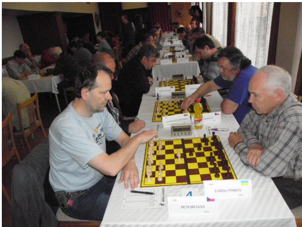
314 Petr Mičulka – IM Evgenij Piankov