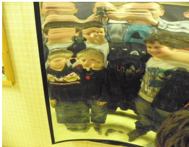
305 před křivými zrcadly