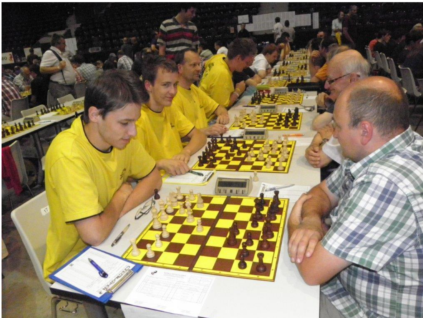
319 Náměšť ve žlutých dresech