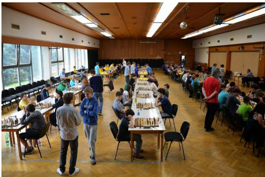
310 finále ELD v Třešti