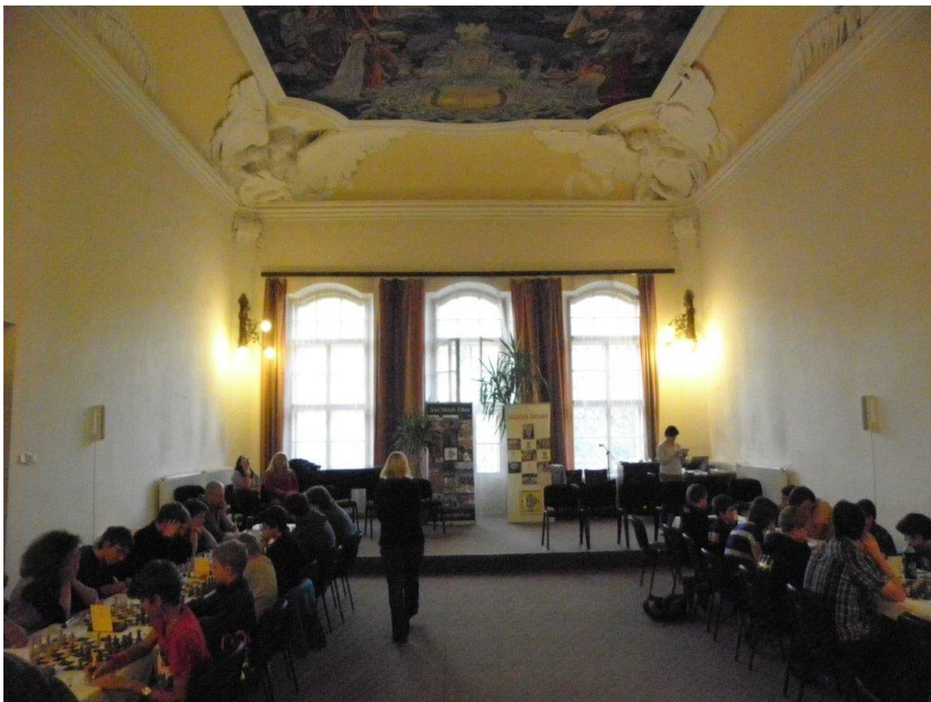
322 nádherný sál „Ceské nebe“