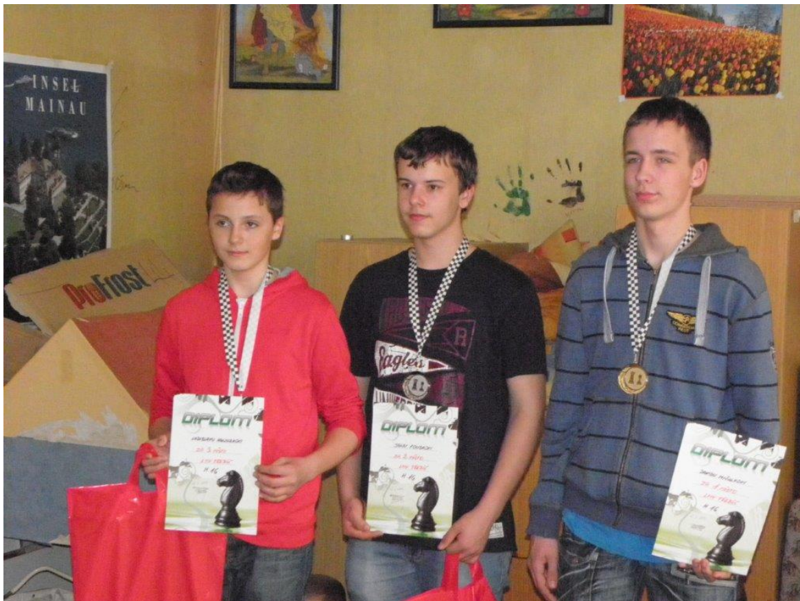
305 David zvítězil s náskokem