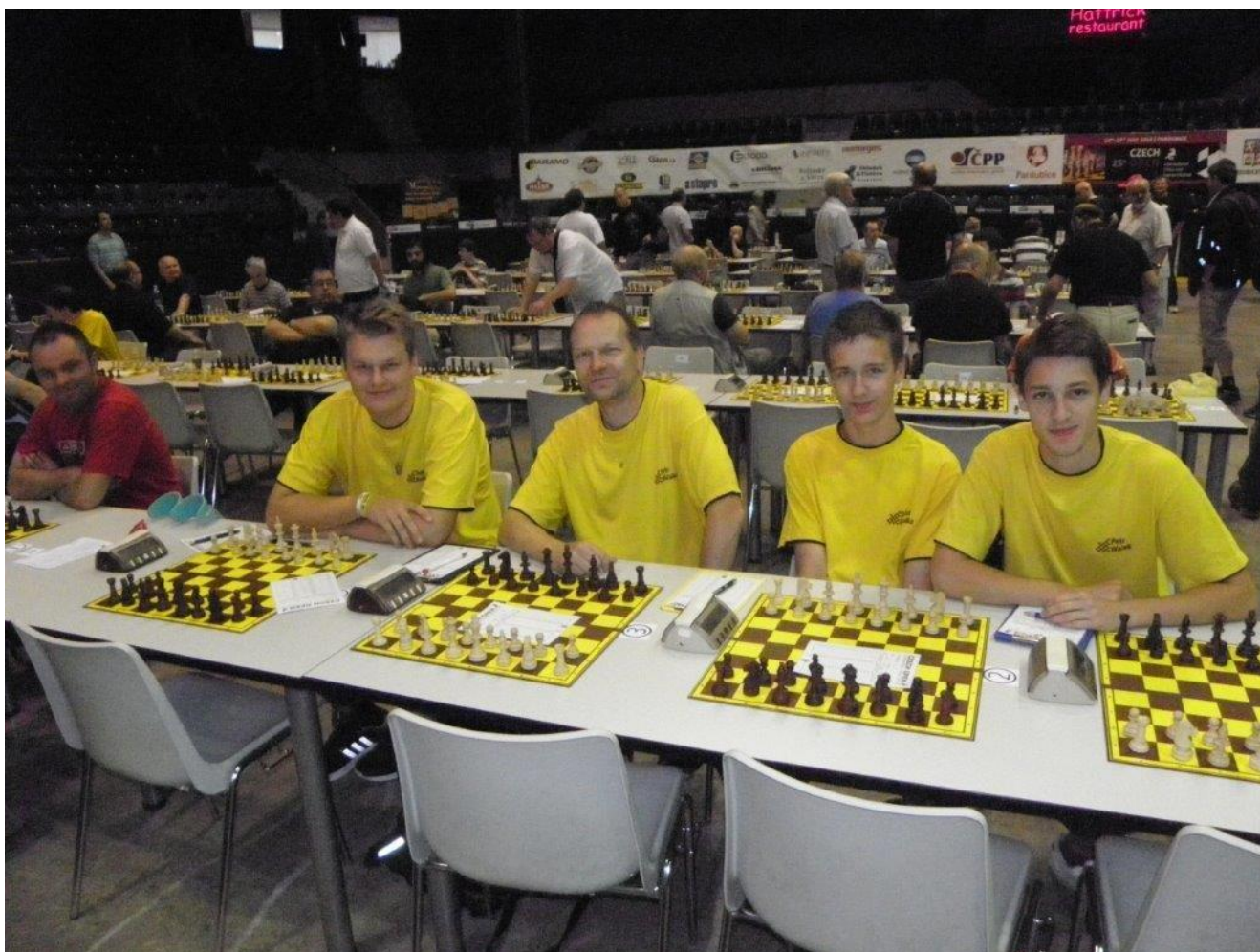
319 Náměšť na MČR 4-členných družstev