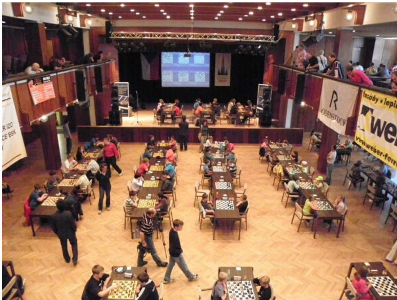
195 MČR mládeže v rapid šachu Klatovy