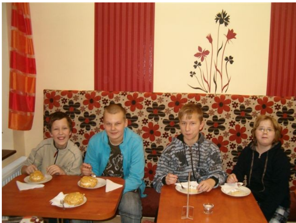
177 oslava v cukrárně u Ráčků