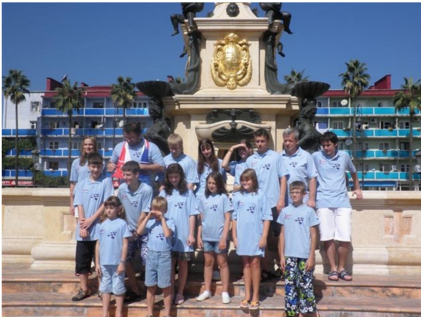
197 výprava ČR na ME v Gruzii (Batumi)