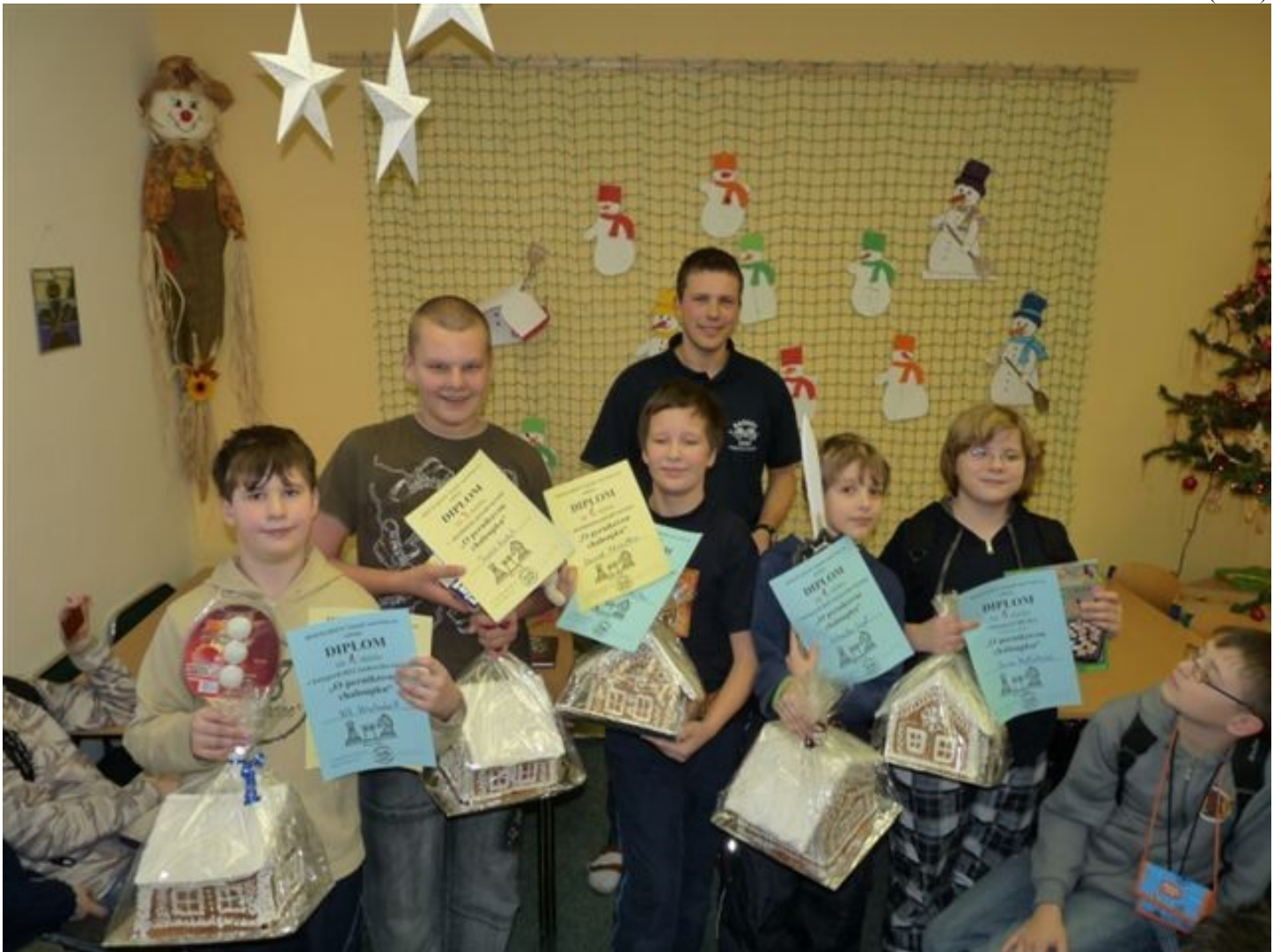
177 perníkoví chalupáři