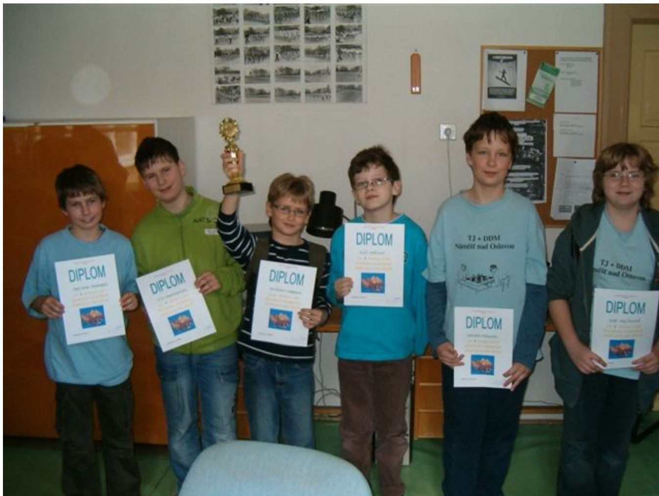
182 Náměšť mladší žáci