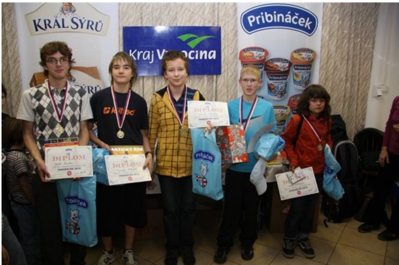
202 Přibináček – vítězové kategorií