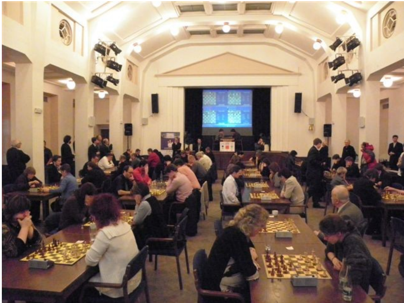
206 MČR v bleskovém šachu, Praha