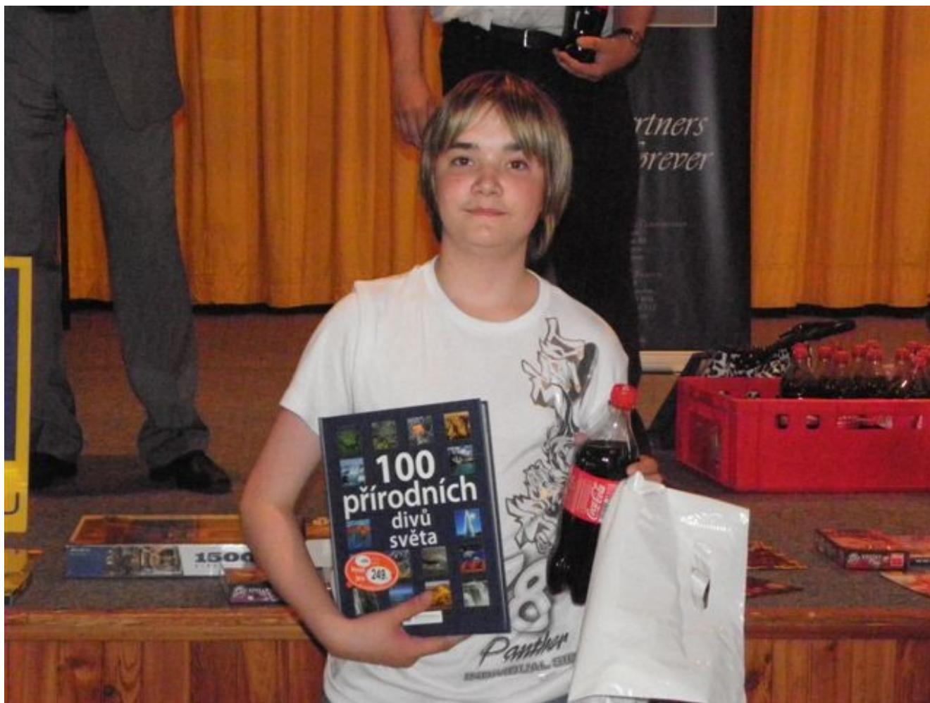
190 Ruda nejlepším žákem i dorostencem v Hustopečích