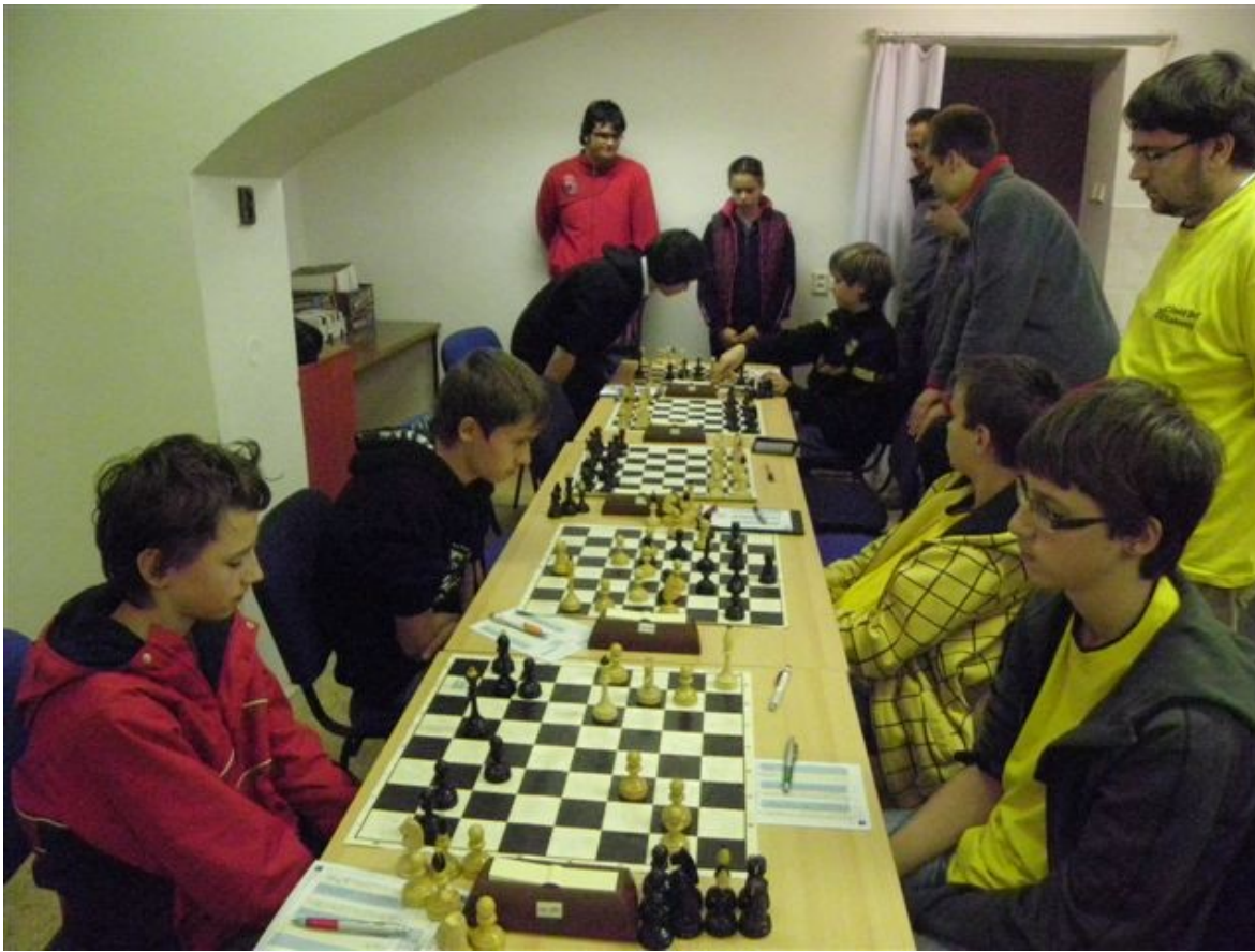
198 první 4 kola Extraligy v Brně