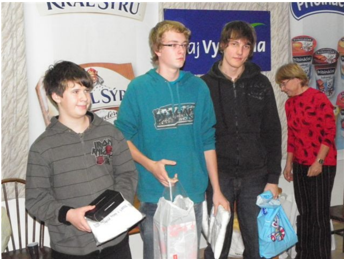
202 Open Přibyslav