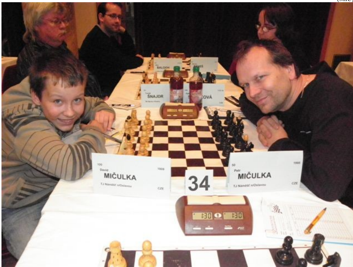
187 Ostravský koník – David proti Petrovi