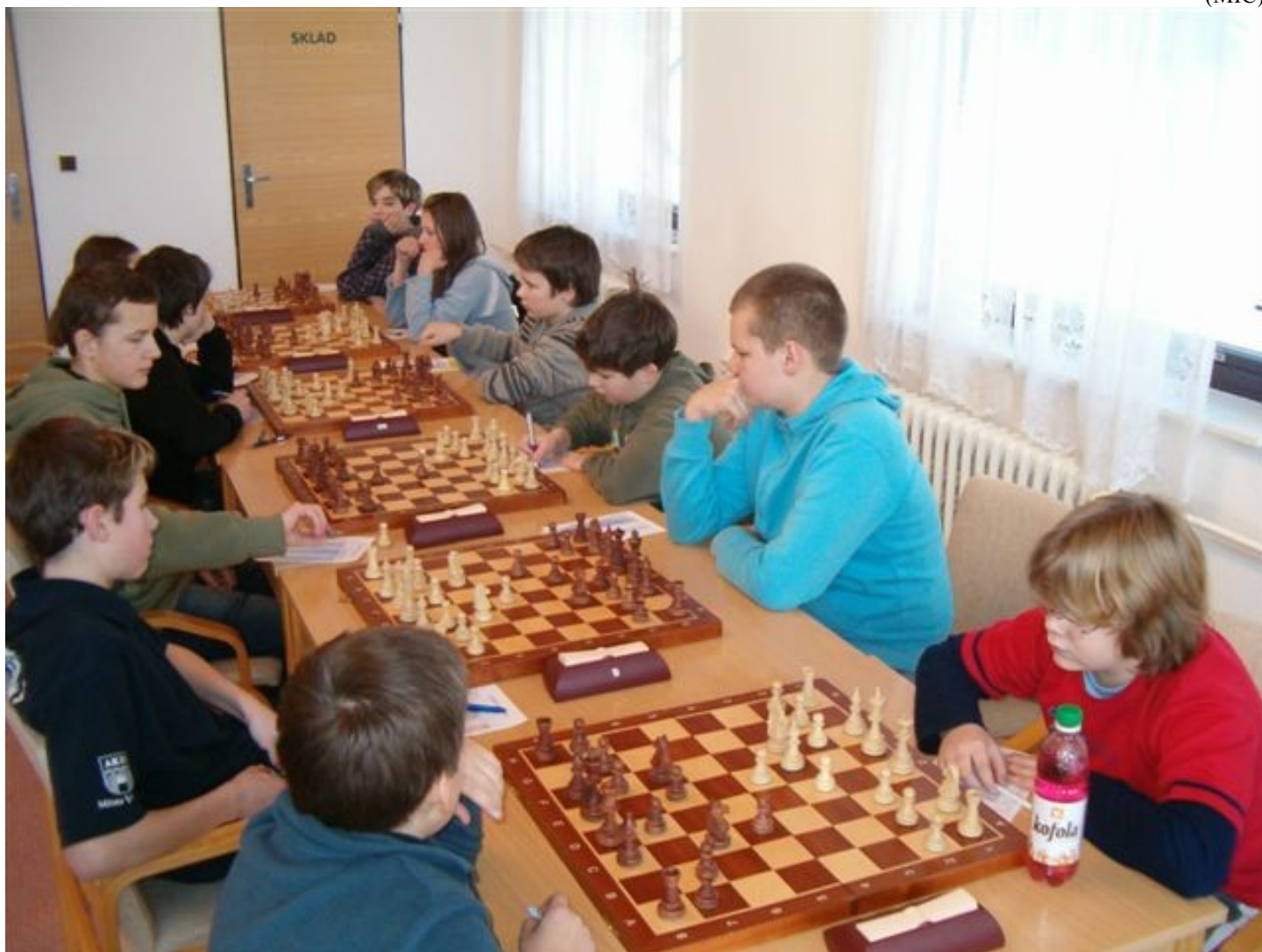
178 Náměšť v zápase 1. ligy s Vlašimí