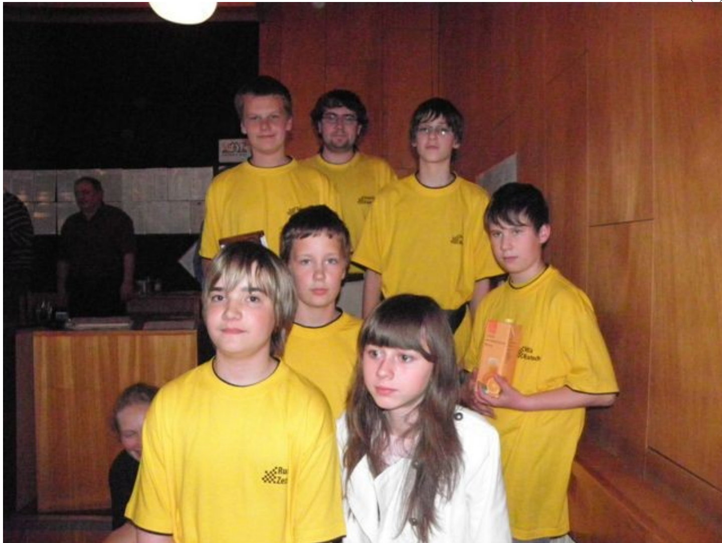
189 družstvo starších žáků