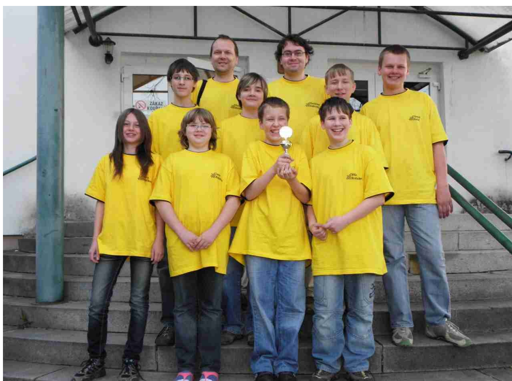
186 Náměšť vyhrála 1.ligu a bude hrát Extraligu dorostu !!!