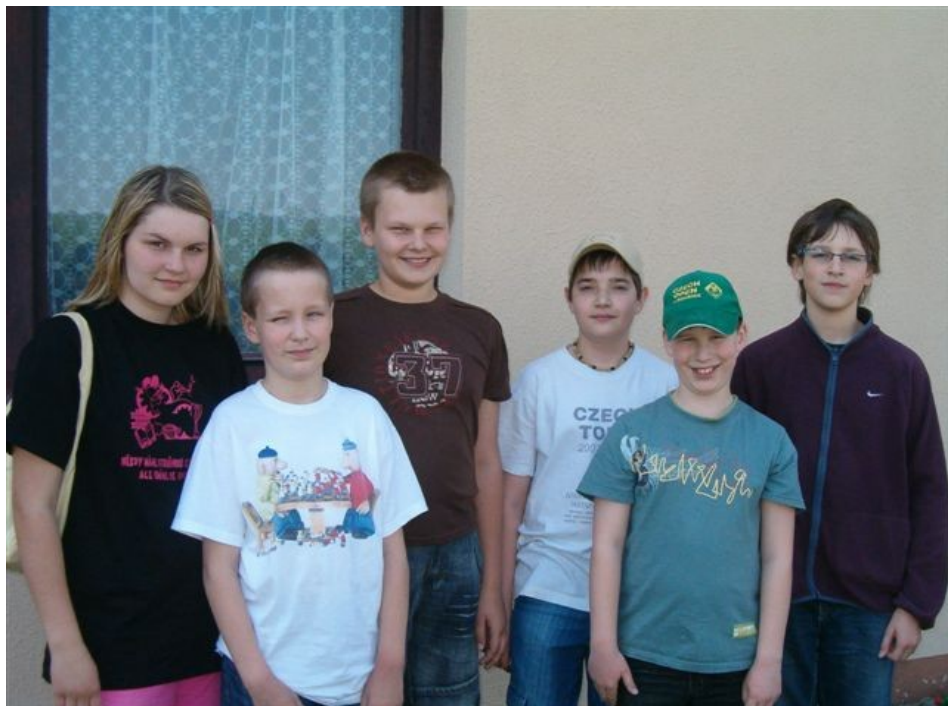
157 mladší dorost TJ Náměšť nad Oslavou