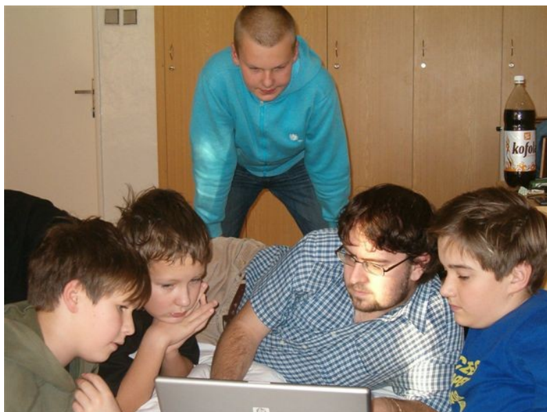
170 příprava na další kolo