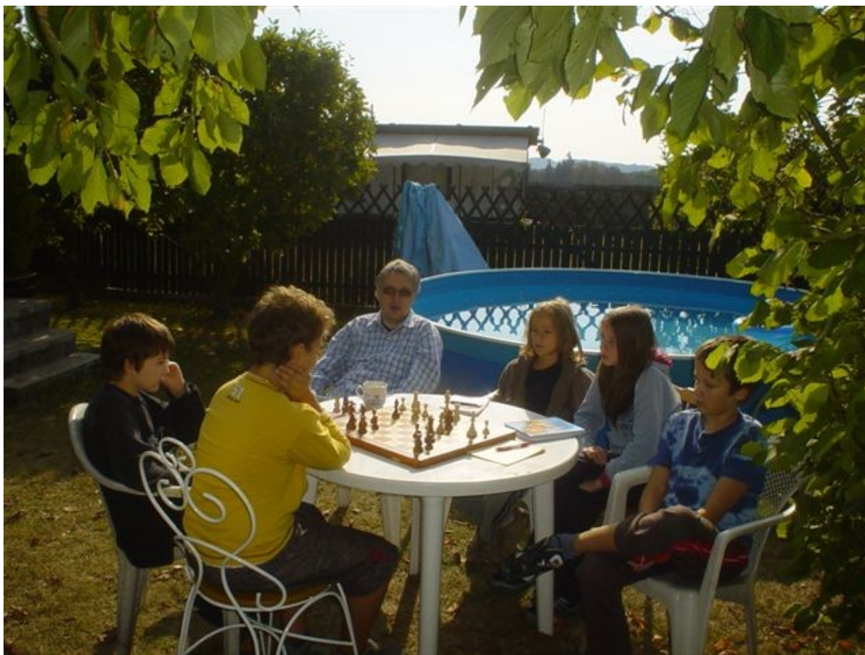
167 Davidova skupina