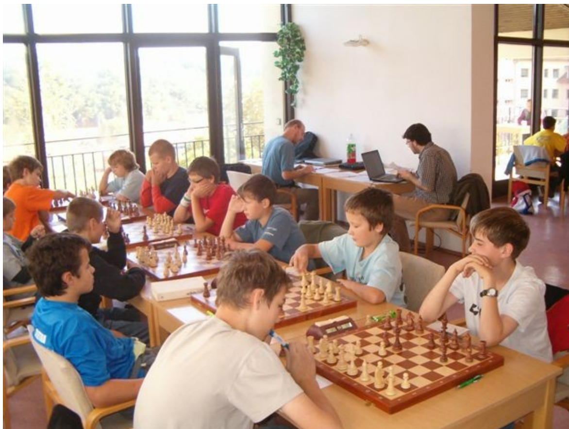
169 1.liga mladšího dorostu