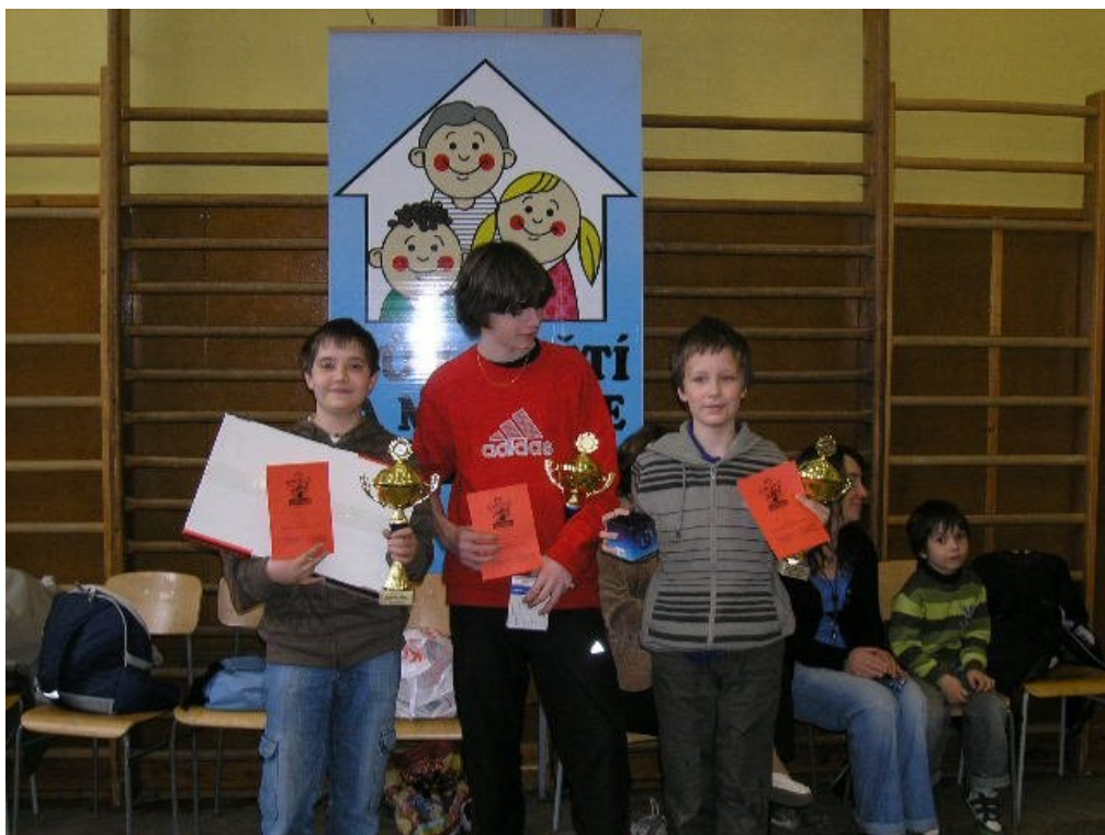
156 vítězové v Šumné