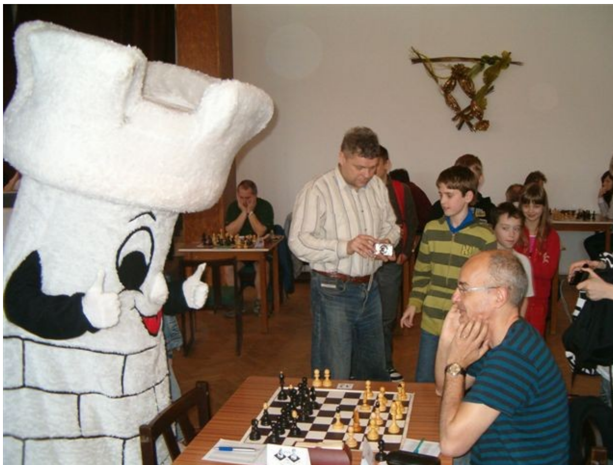
155 Frymík v akci