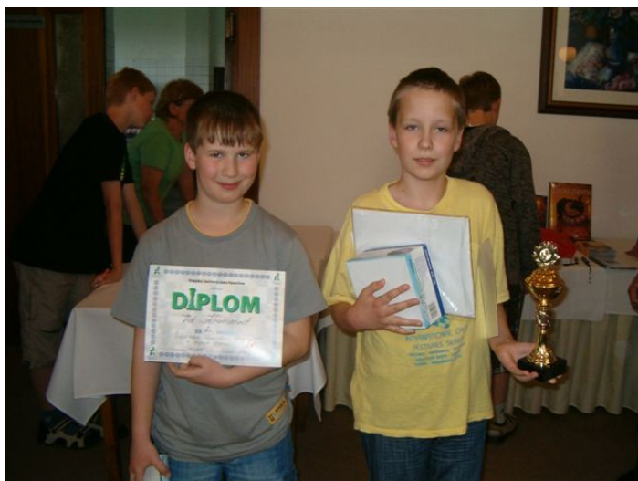
159 vítězové H12