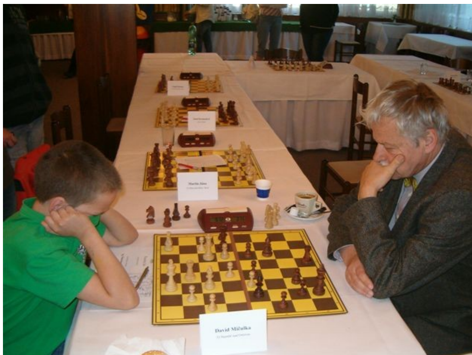
158 GM Vlastimil Hort