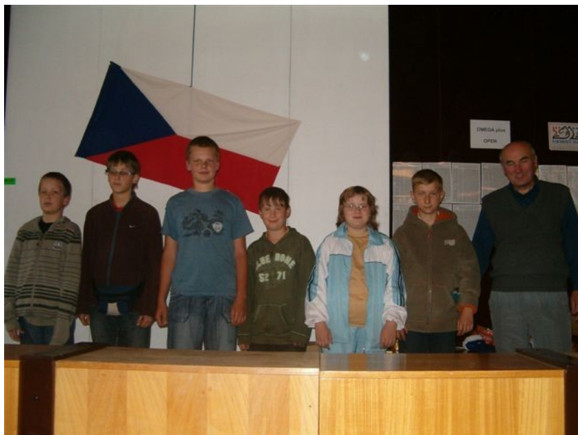
160 družstvo starších žáků