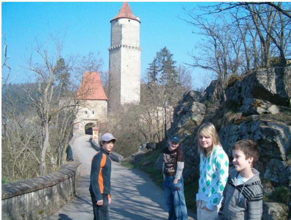
154 na Zvíkově