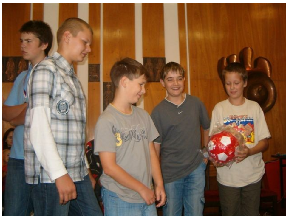
164 Náměšť 5. místo