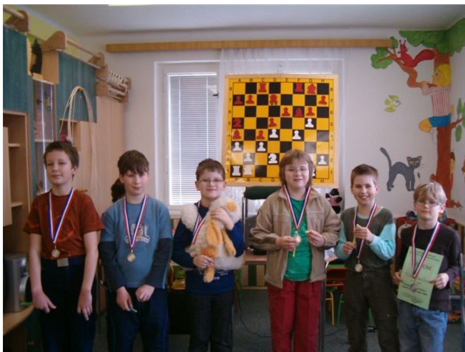
153 Náměšť mladší žáci

Vítězné družstvo postupuje na MČR družstev mladších žáků 2008 v Sezemicích.