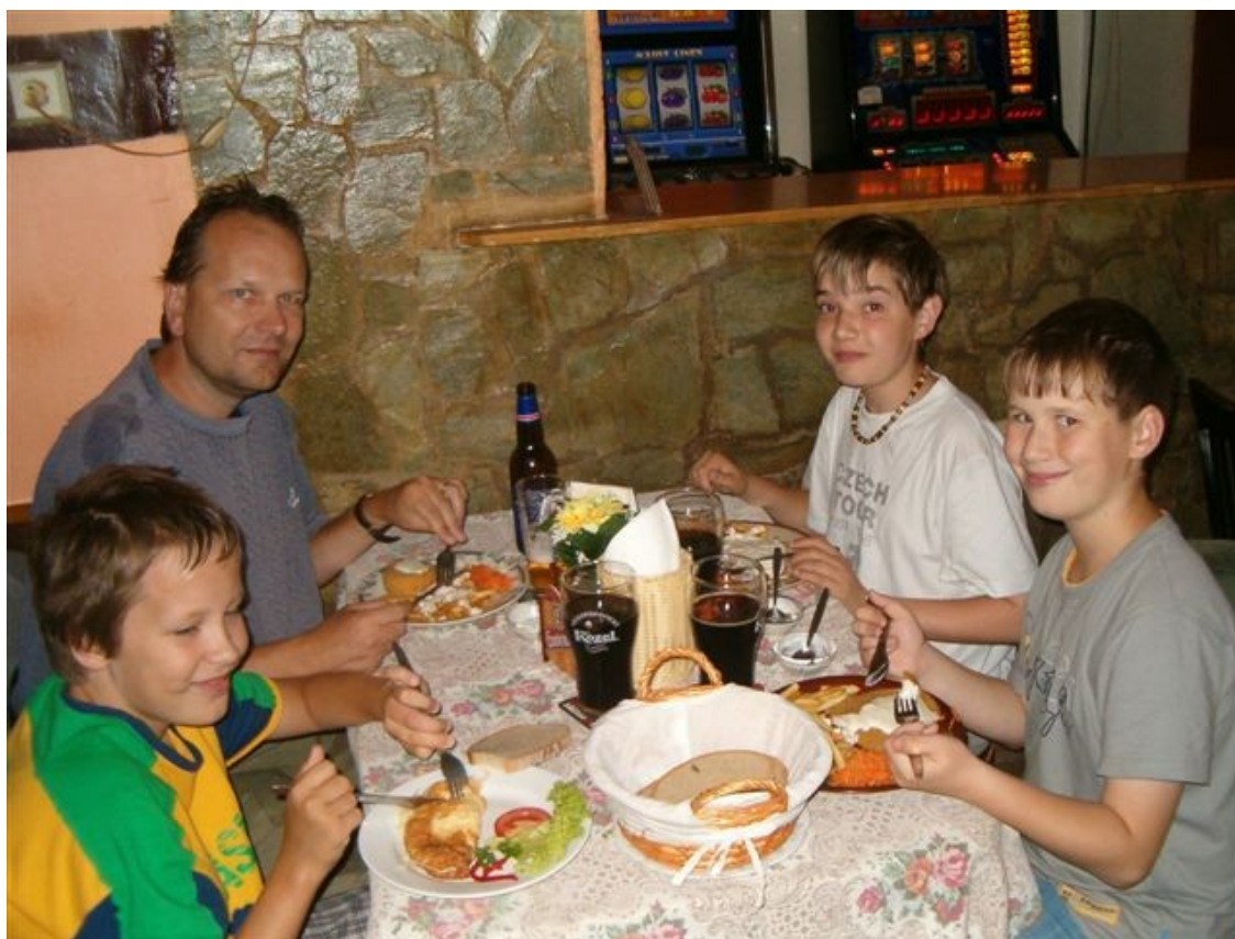
163 družstvo Náměšť