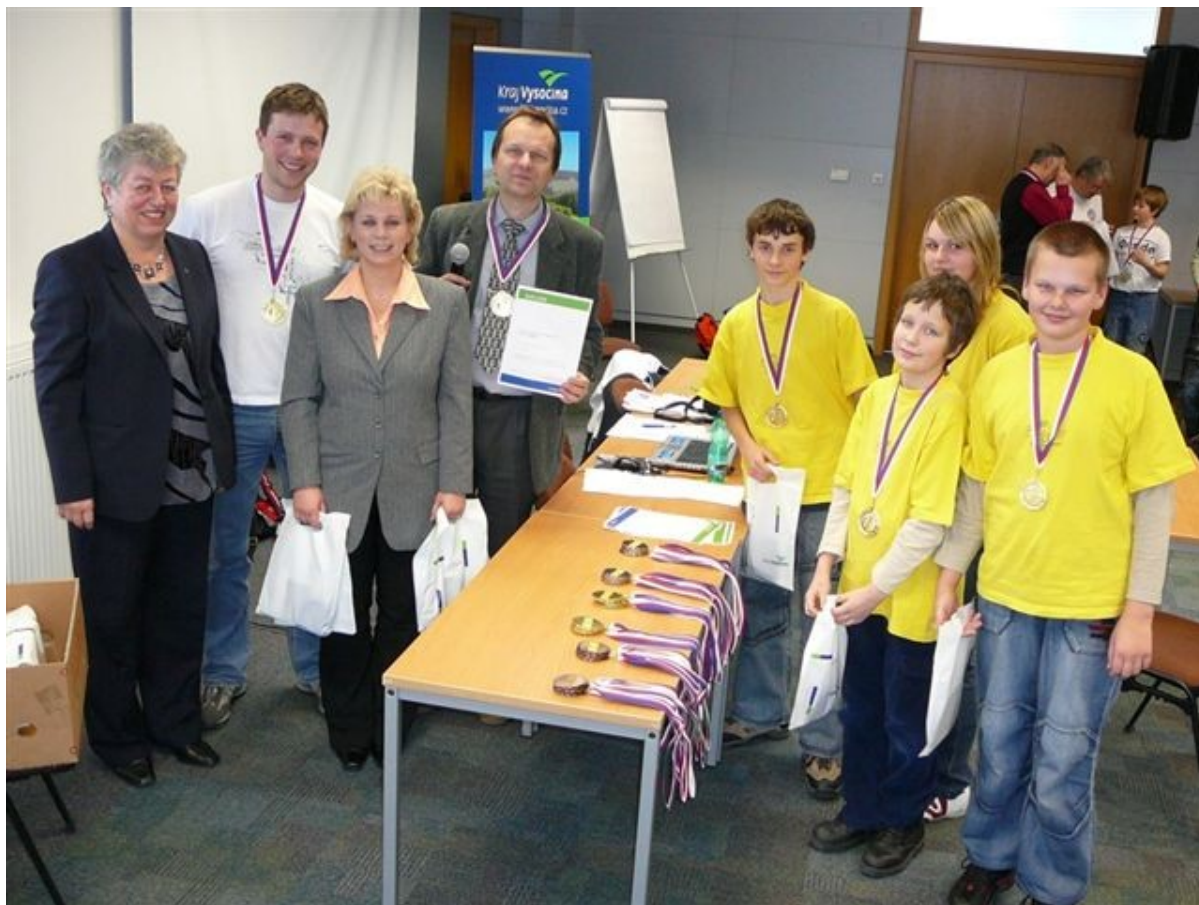
151 starší žáci ZŠ Husova 1. místo

Postupujícím družstvům přejeme na republikových kolech hodně hezkých sportovních výsledků a dobrou reprezentaci Vysočiny! (MIČ)