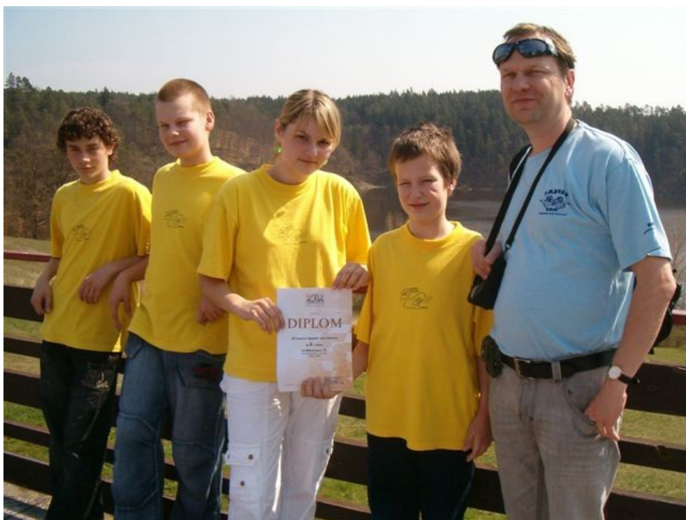
154 ZŠ Husova 6. v ČR