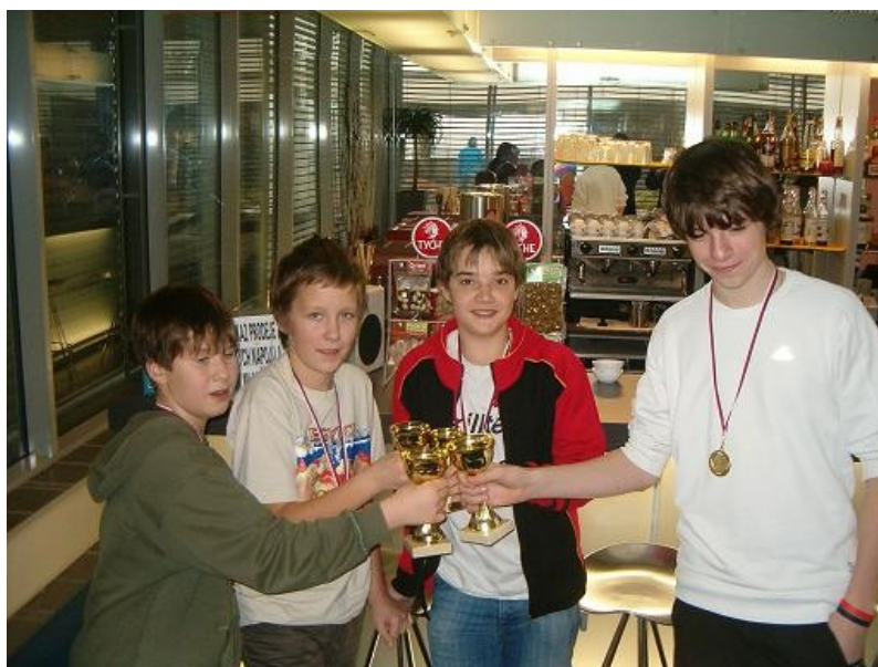
170 A ještě jednou, tentokrát přípitek všech čtyř vítězů.