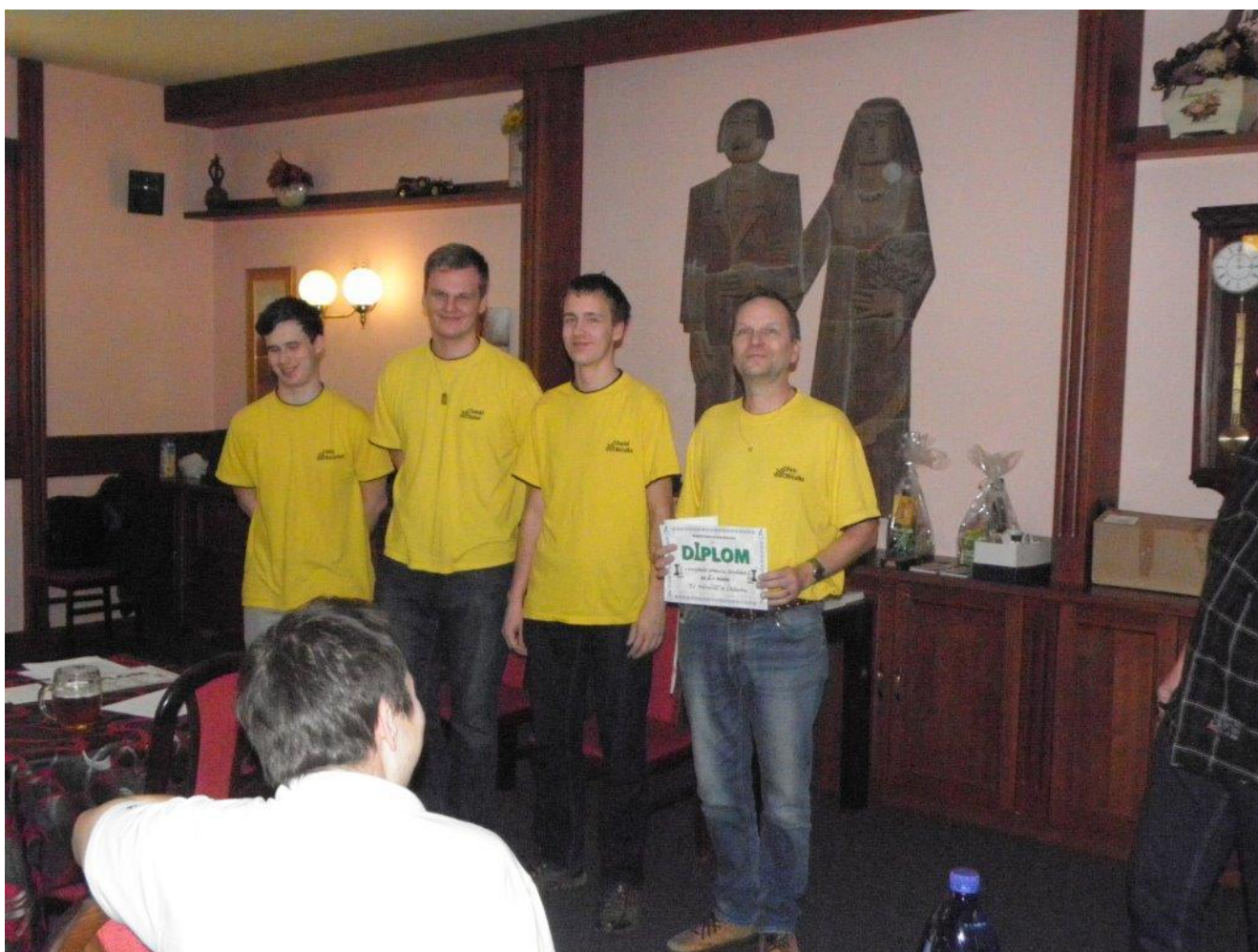
359 družstvo Náměště druhé v KP