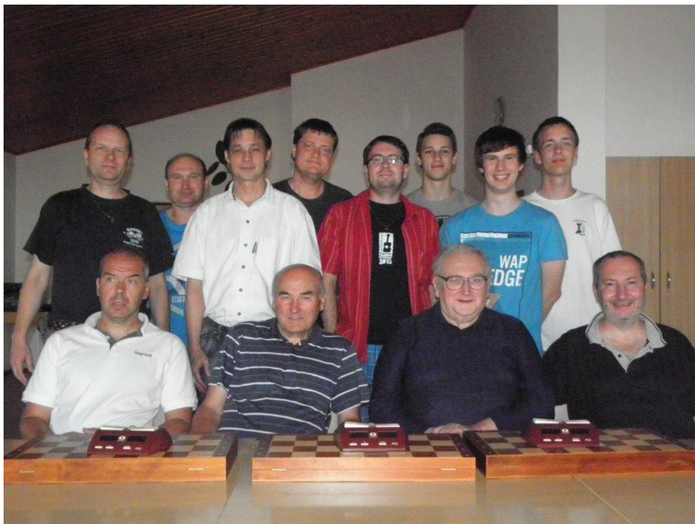
349 rozlučka se sezónou – společné foto