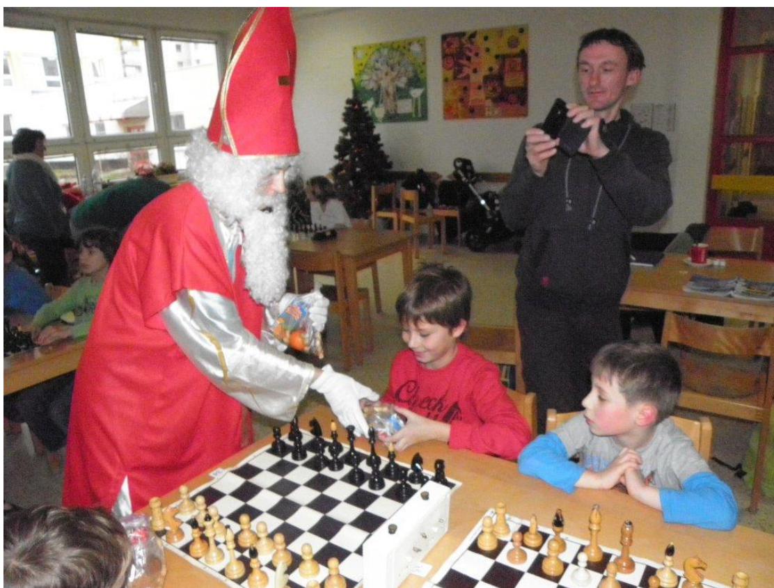
356 Mikuláš naděluje