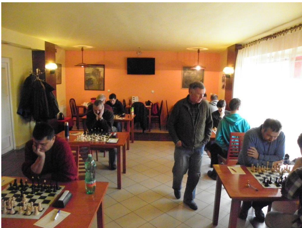
355 Hrací místnost ve Velkém Meziříčí