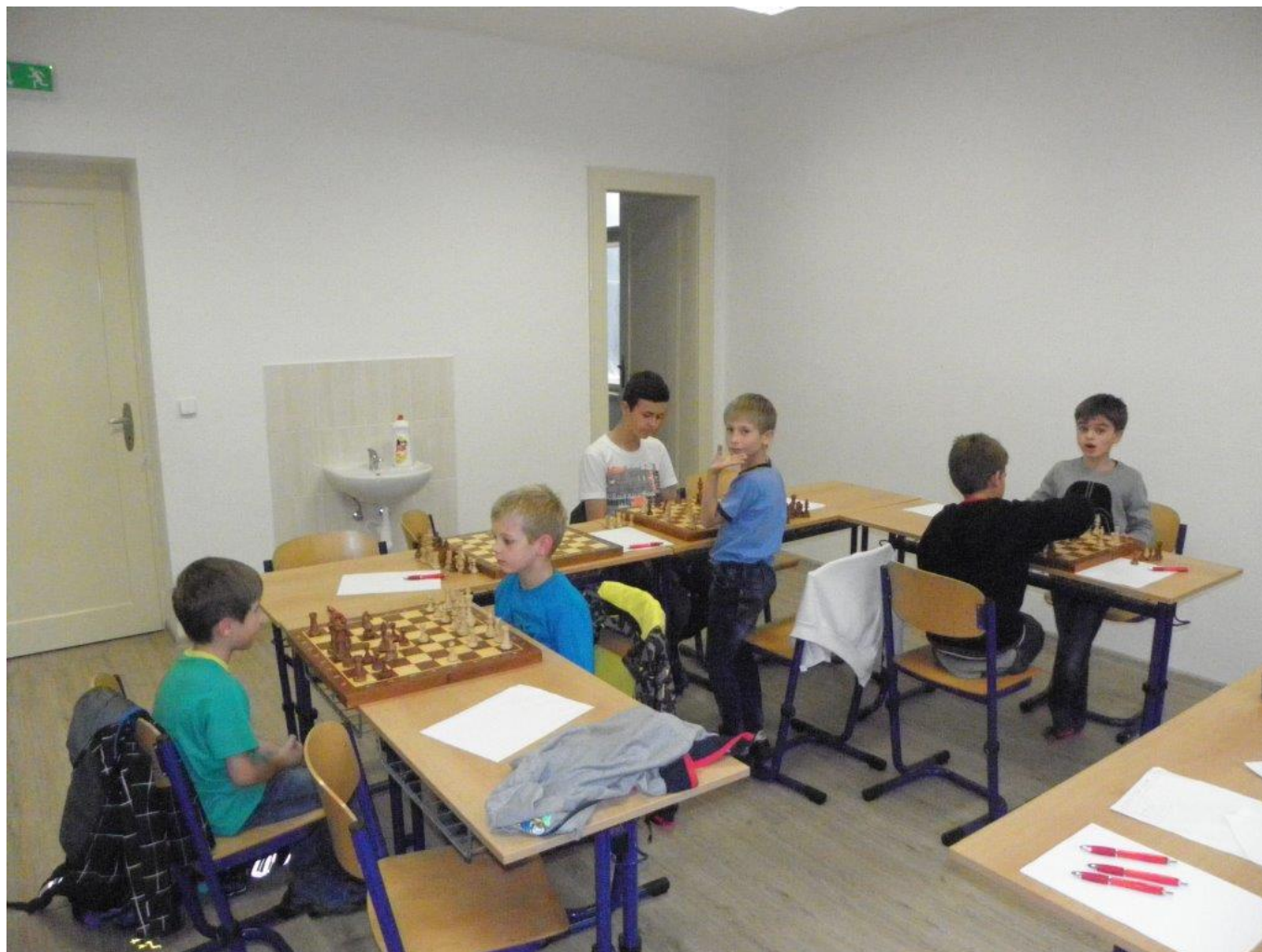
352 Prostorné místnosti v novém sídle DDM – ve Špirkově vile

V následujících kroužcích se budeme učit, jak zapisovat šachovou partii a samozřejmě opakovat a prohlubovat znalosti z předchozích kroužků. Věřím, že se budete na kroužky těšit jako dosud a budete se rychle zlepšovat, abychom již v tomto školním roce mohli hrát v některých ze seriálu 10 turnajů Ligy Vysočiny (KP mládeže do 16 let s vyhlásováním výsledků v kategoriích do 8, 10, 12, 14 a 16 let). Dva zkušenější z kroužku již mají takových turnajů za sebou více s výbornými výsledky a jejich umístění v turnajích se neustále vylepšuje.