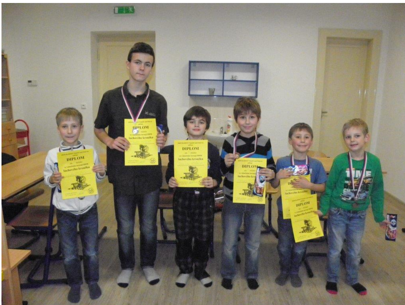
358 Předvánoční turnaj