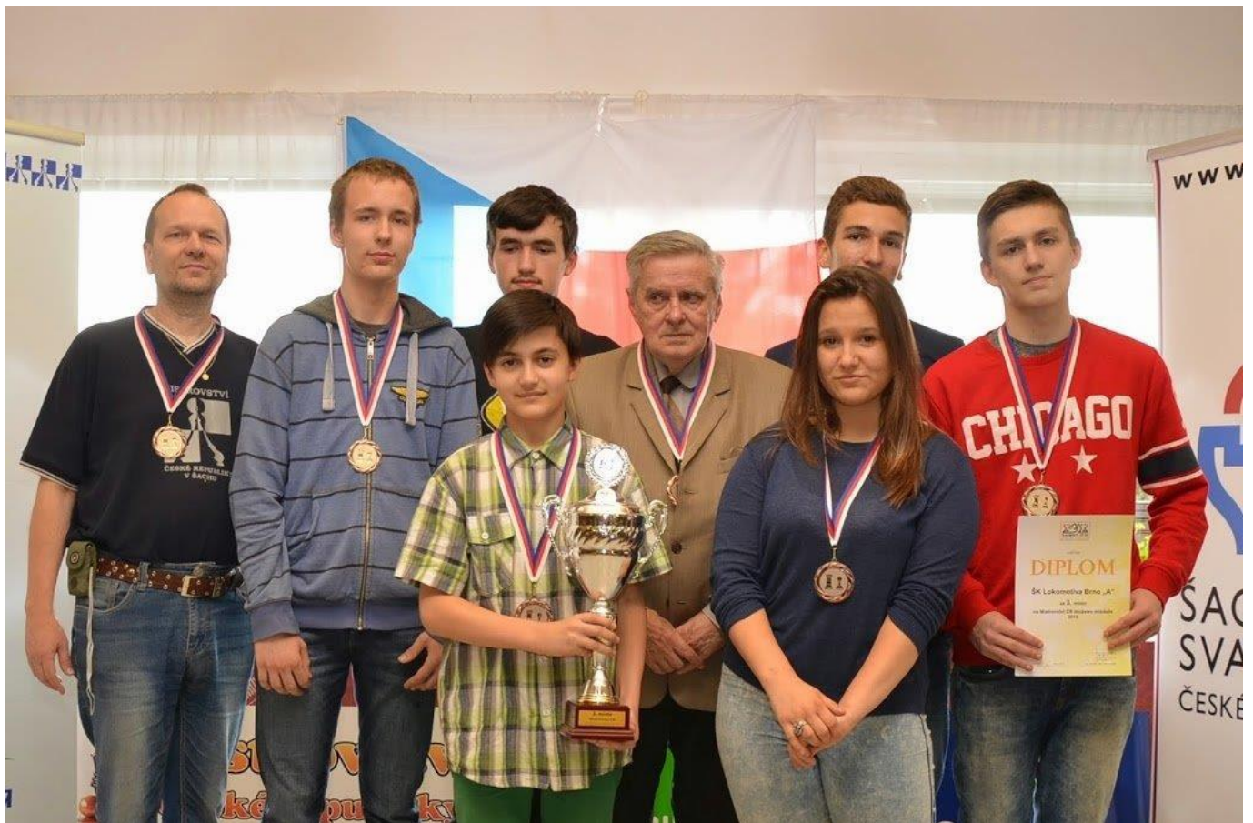
346 David bronzový s Brnem