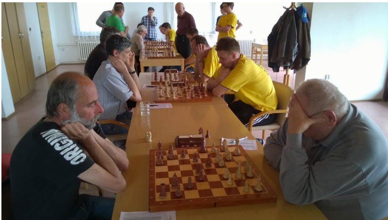
345 Náměšť – Třebíč B 5,5 : 2,5