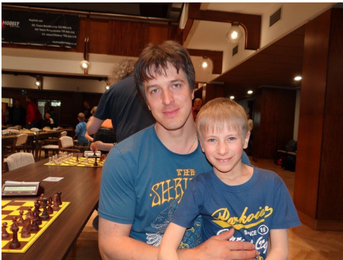
347 Kuba s tátou