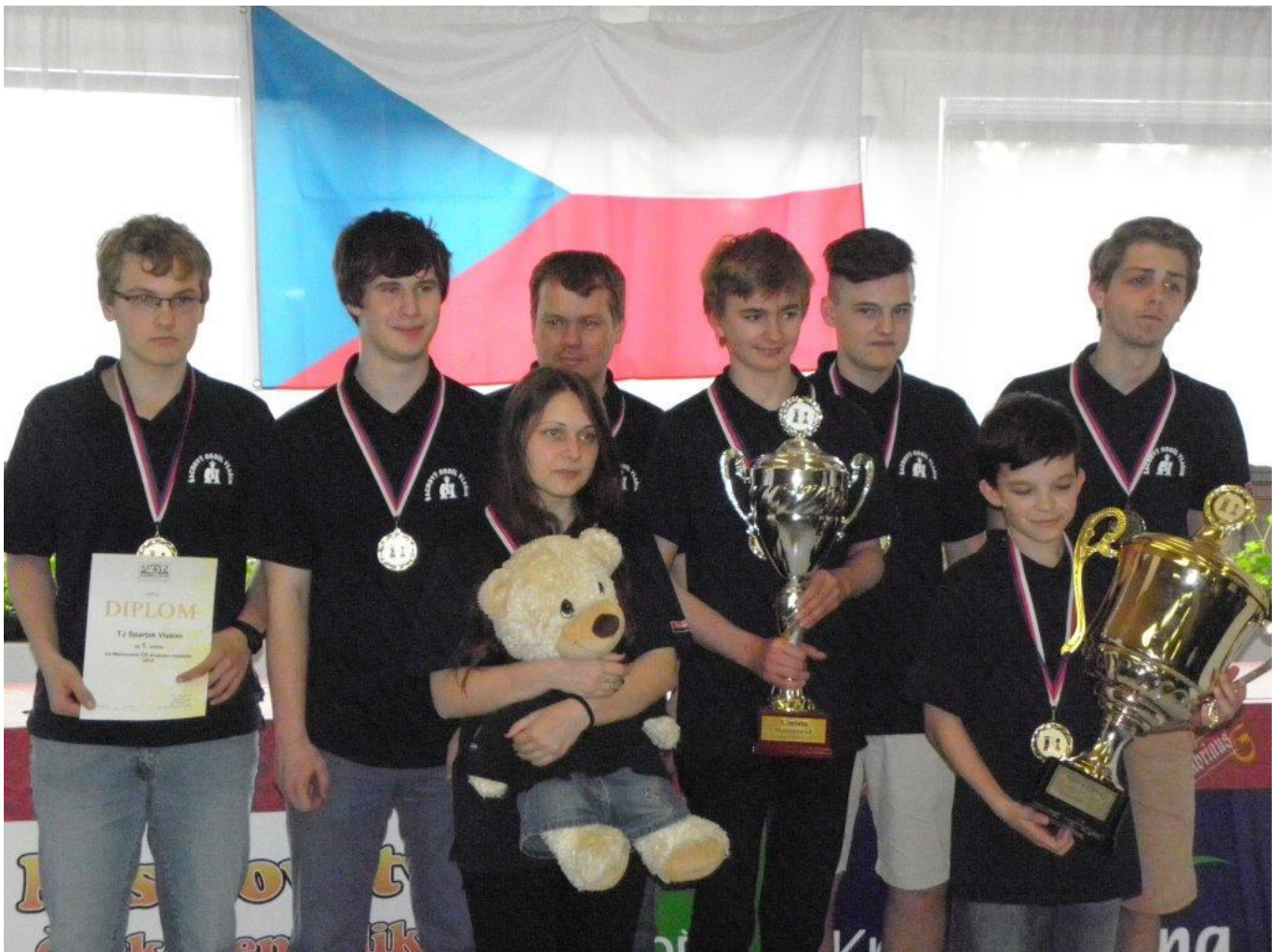
346 Vítě zlatý s Vlašimí