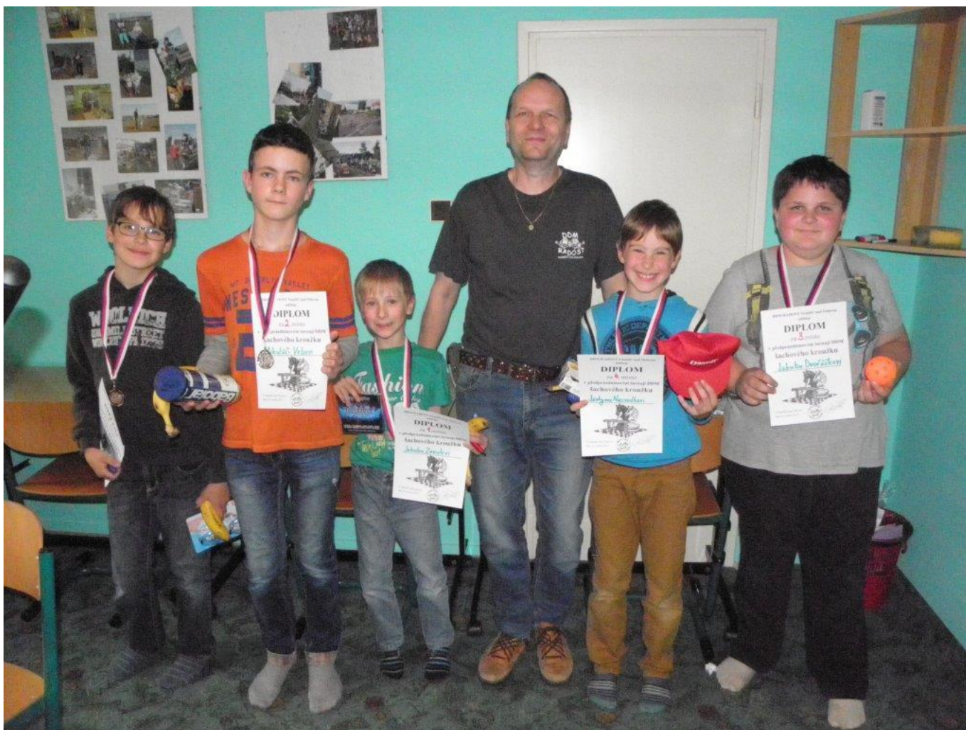
348 vyhodnocení turnaje