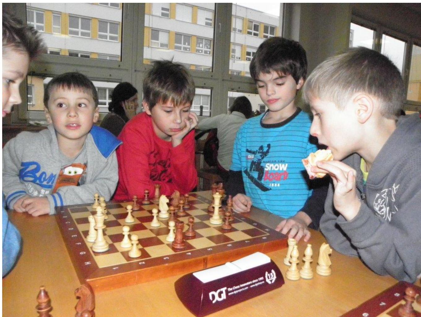
356 Čtveřice z Náměště před začátkem turnaje