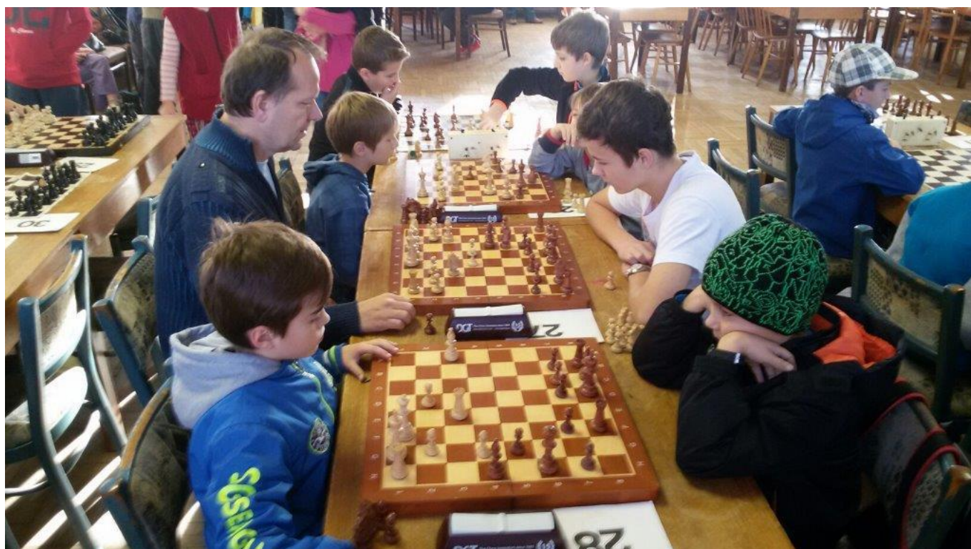
353 příprava před zahájením turnaje