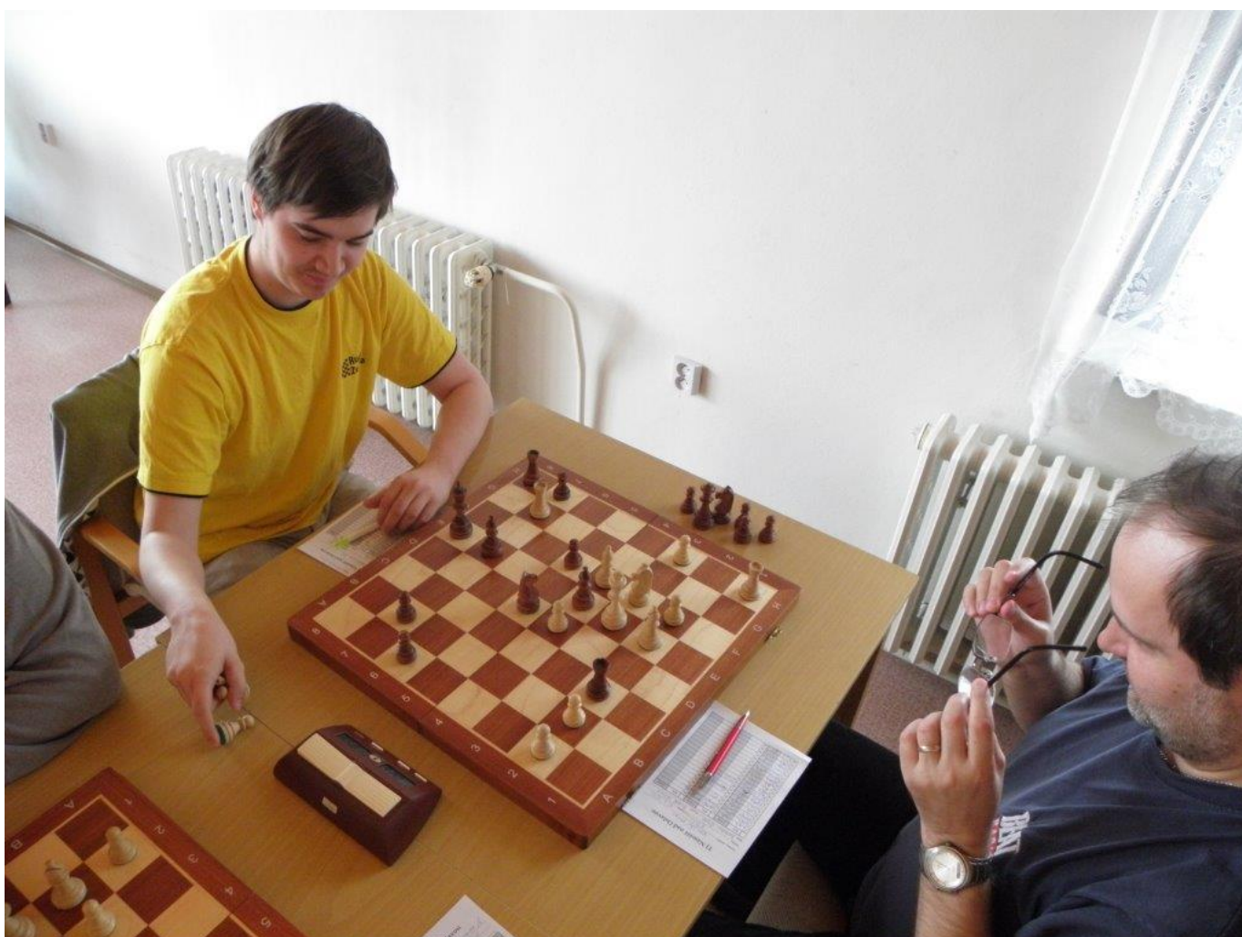
345 Ruda dal hezký mat jezdcem soupeřovu králi uprostřed šachovnice