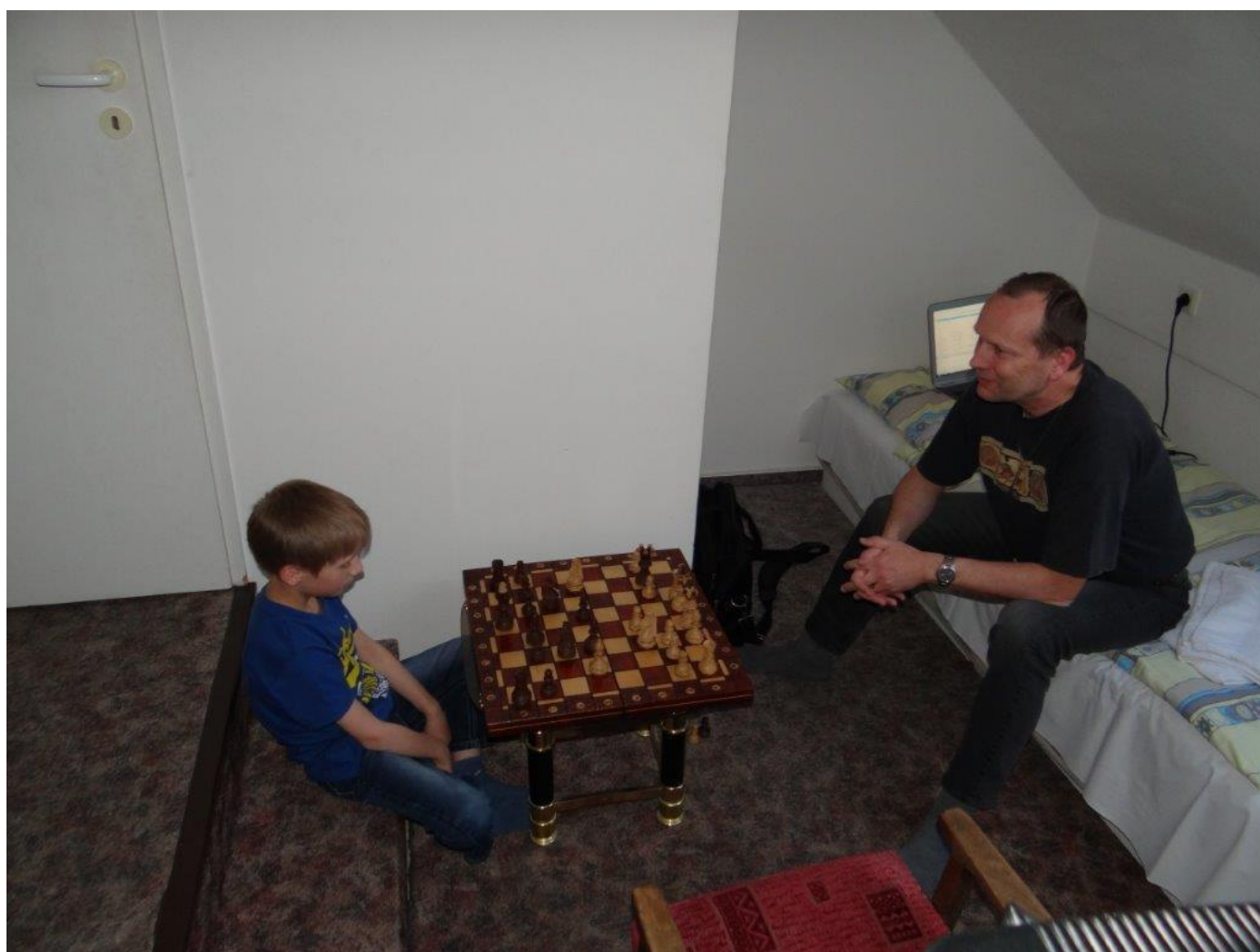
347 tréninková příprava v Klatovech před MČR