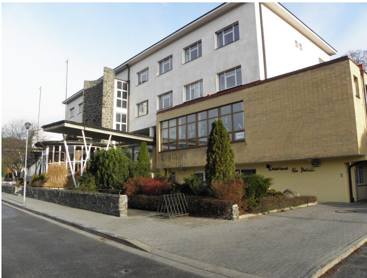
353 Dům zdraví Velké Meziříčí, v přízemí je hrací místnost