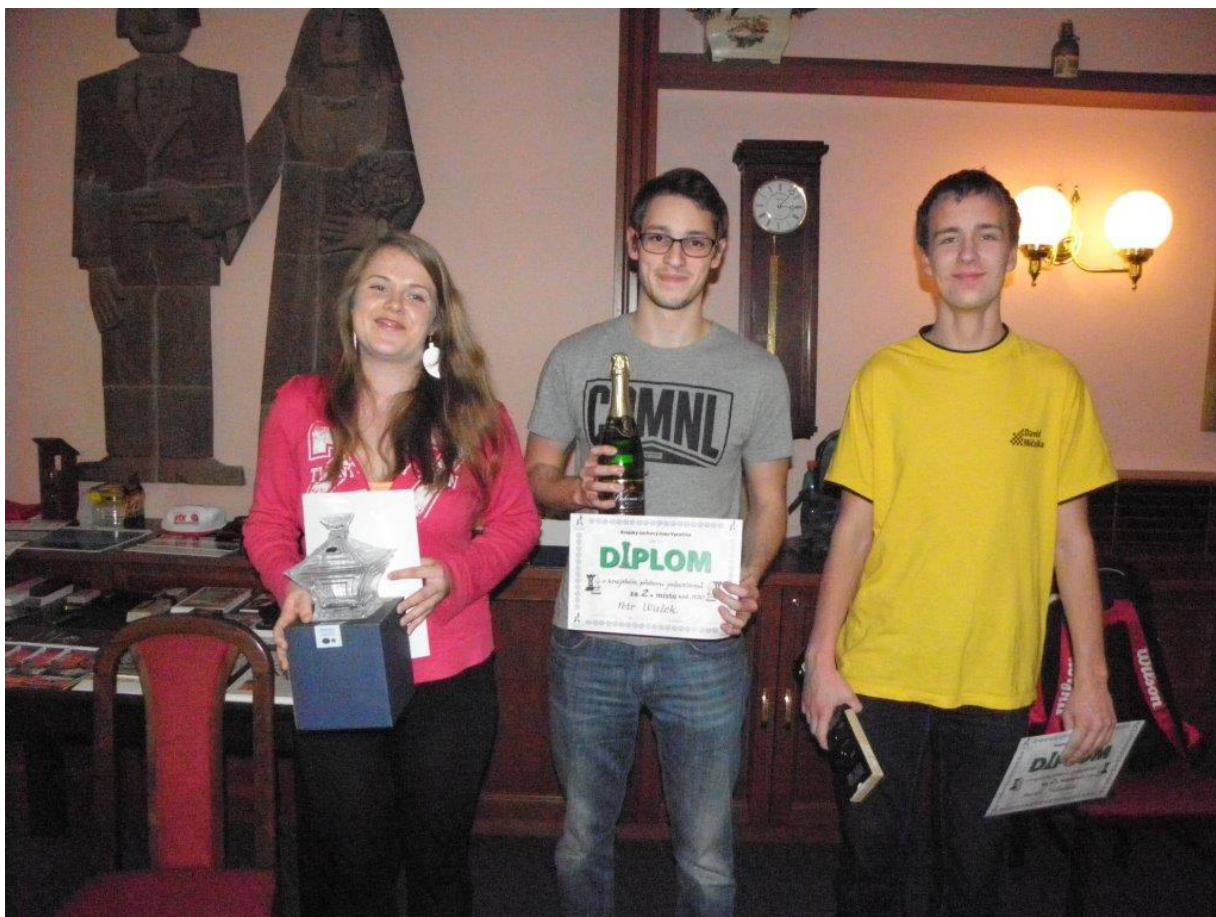
359 druhá místa v ženách, juniorech do 20 let a dorostencích do 18 let