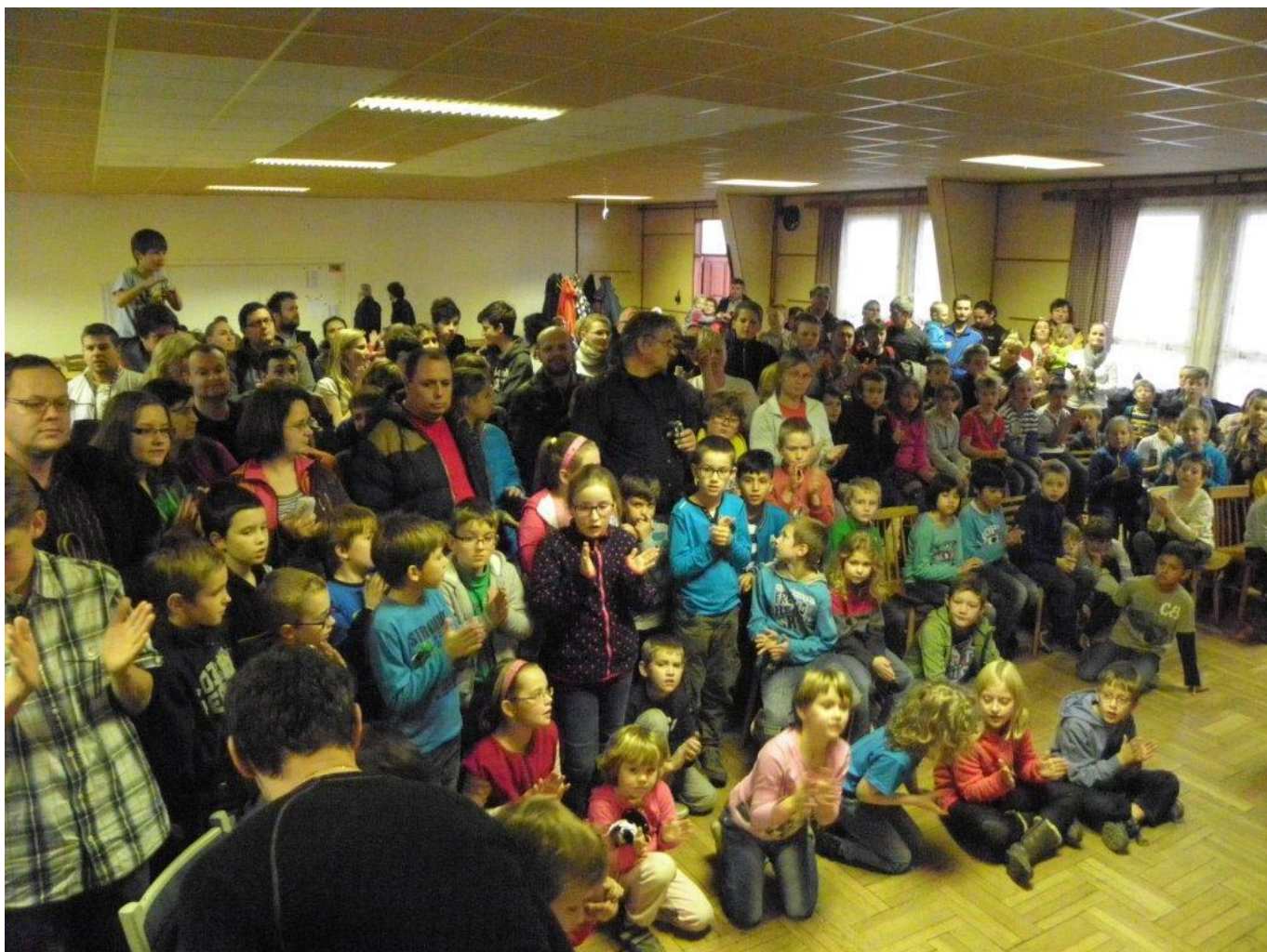
353 početná účast v Jihlavě