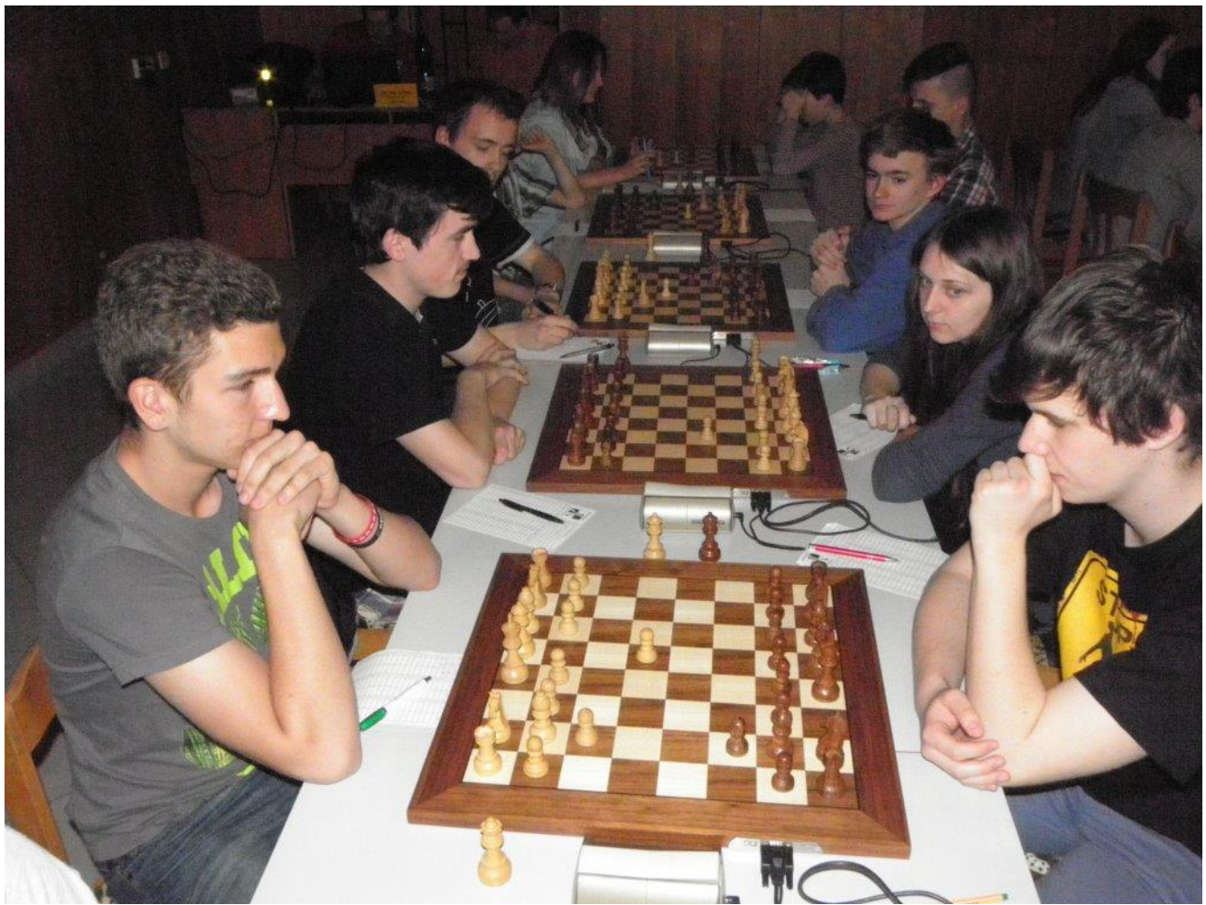
346 Vít'a proti Brnu