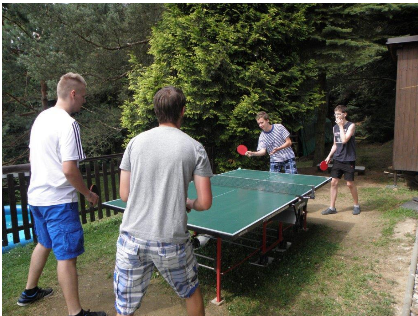
350 příprava u Krčilů na chatě