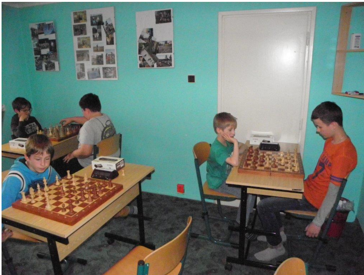
348 předprázdninový turnaj kroužku v plném proudu