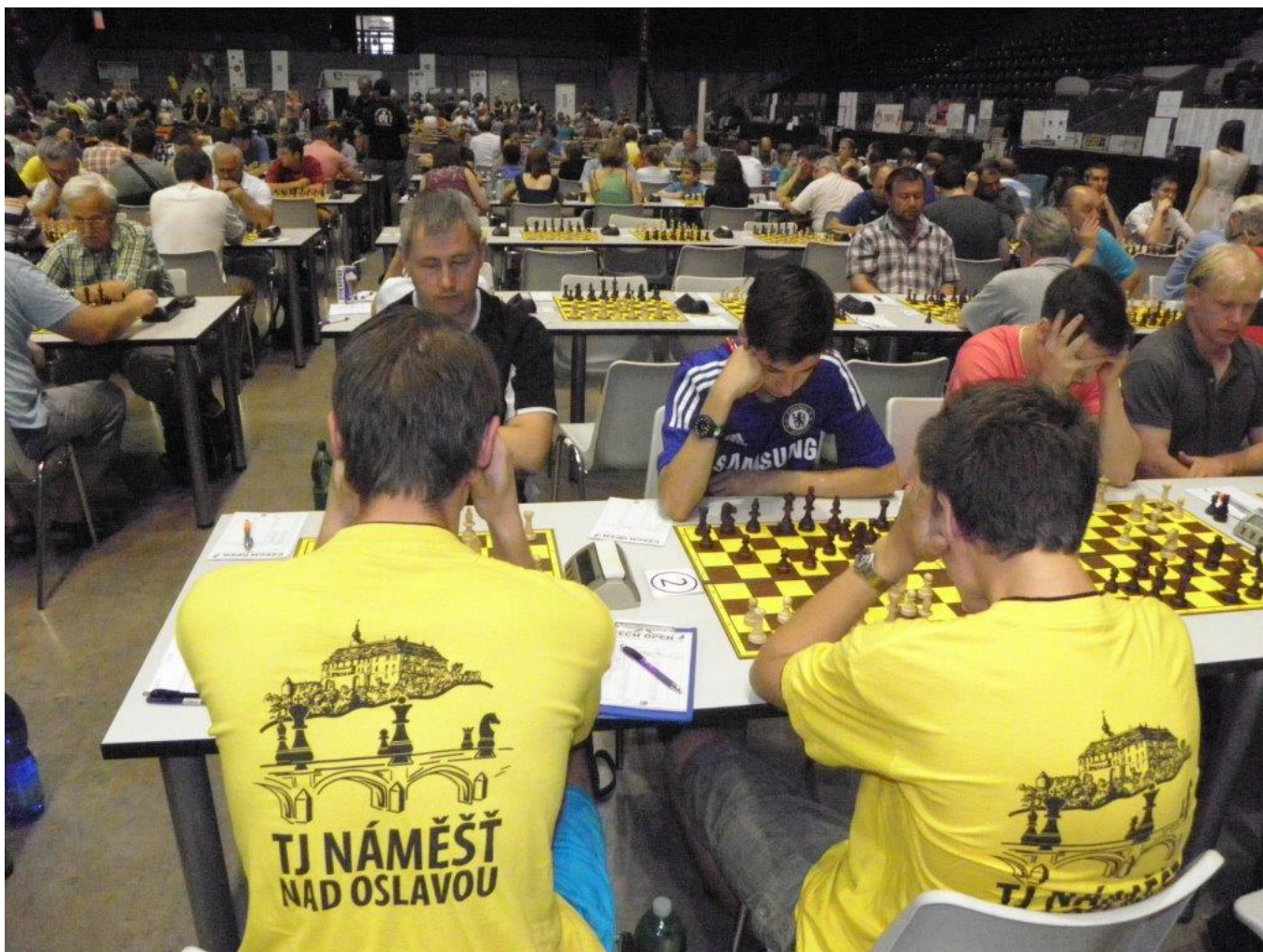
350 Náměšť bojuje na MČR 4-členných družstev