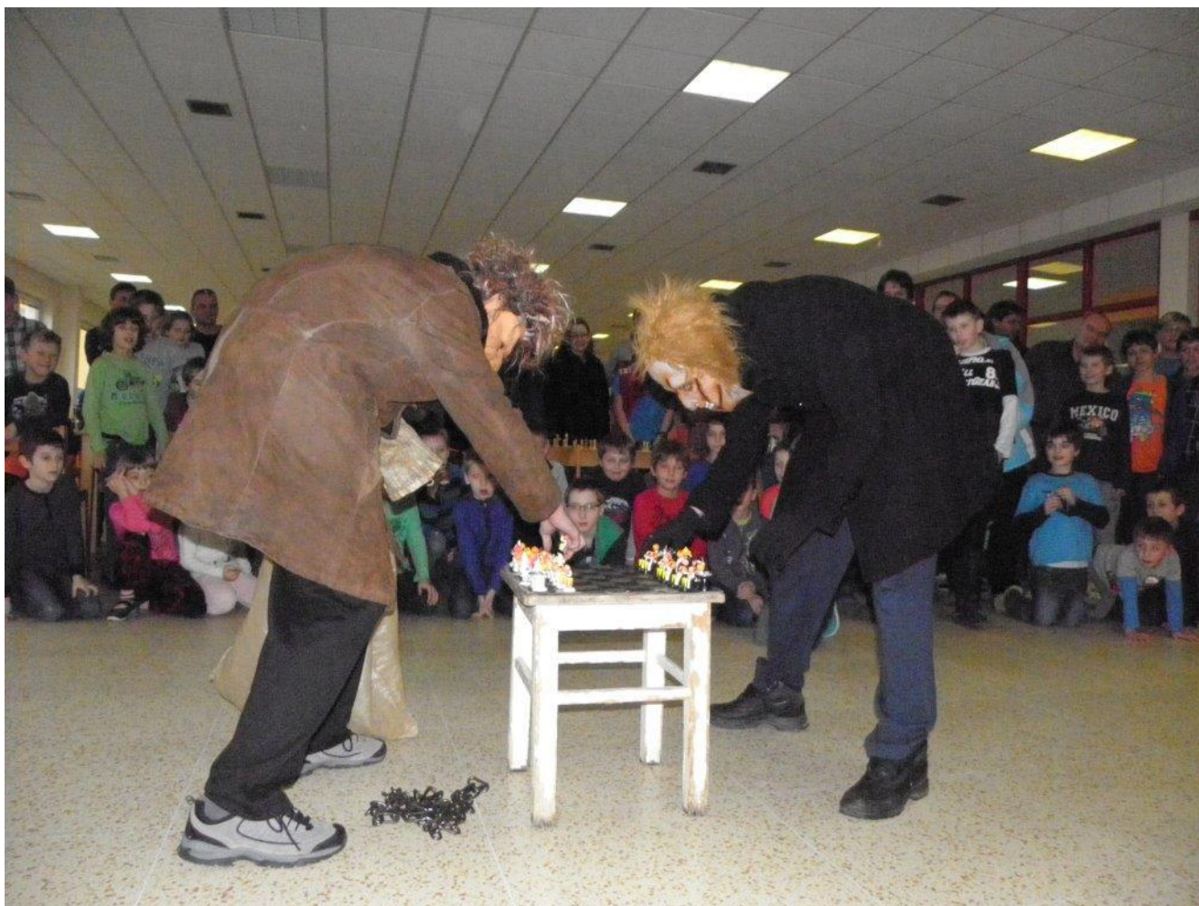
356 Čerti hrají šachy