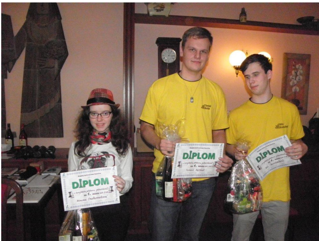
359 první místa v ženách, junirech do 20 let a dorostencích do 18 let