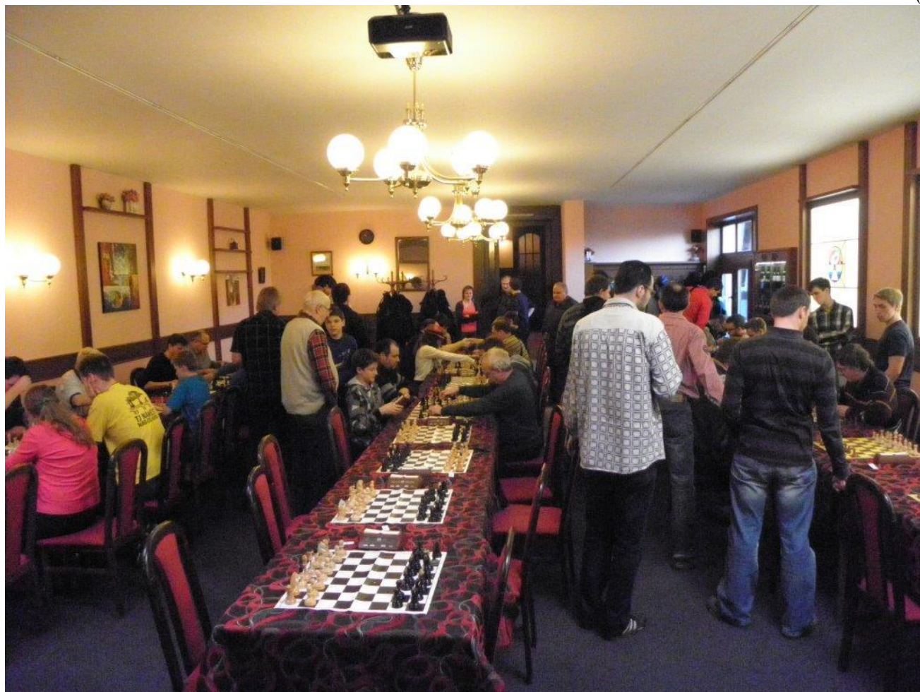
359 hotel Hajčman ve Žďáru poskytl šachistům velmi pěkné prostředí